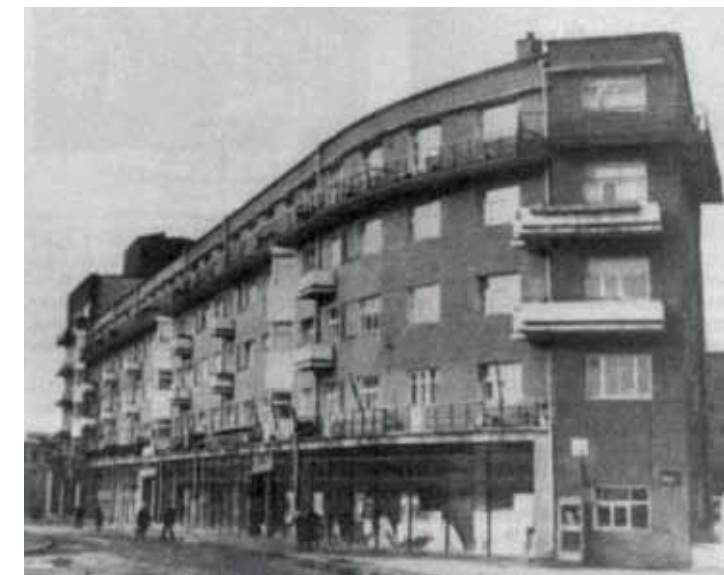
Дом-корабль во Втором рабочем поселке. Архитектор Д.Ф. Фридман. Фотография. 1970-е гг.

Со строительством в городе новых предприятий и увеличением населения резко встал жилищный вопрос (количество жителей Иваново-Вознесенска выросло с 52 тысяч в 1920 году до 130 тысяч в 1926-м). С конца 1920-х годов в губернии начался переход от малоэтажного жилищного строительства к капитальному многоэтажному. Дом коллектива на 400 квартир (арх. И.А. Голосов; 1929–1931), задуманный как дом-коммуна и уже на этапе строительства переориентированный под индивидуальное жилье, представлял собой целостный комплекс из четырех корпусов, включавший ясли, детский сад, столовую, прачечную и зал собраний. Голосов использовал необычный композиционный прием: развернул объемы здания не по вертикали, а по горизонтали, уделяя особое внимание выразительности асимметричной композиции фасада, обращенного в сторону основной магистрали (похожим образом Голосов поступил при проектировании жилкомбината в Сталинграде в 1930 году).