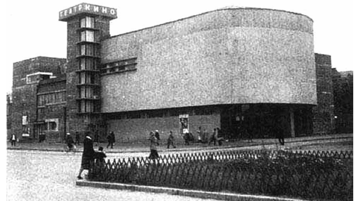
Кинотеатр «Центральный». Архитекторы Е.Ю. Брокман, В.М. Воинов. Фотография. 1930-е гг.

На участке проспекта Ленина между площадью Пушкина и Революции в эклектичной застройке XIX–XXI веков некогда выделялись два оригинальных примера конструктивистского направления, ныне представляющие собой образцы сталинского ампира. Это Центральный почтамт (арх. Г.С. Гурьев-Гуревич; 1929–1931) и кинотеатр «Центральный» (арх. Е.Ю. Брокман, В.М. Воинов; 1929–1931), ставший после реконструкции 1990-х годов ТЦ «Плаза». Единственным полностью сохранившимся образцом архитектуры