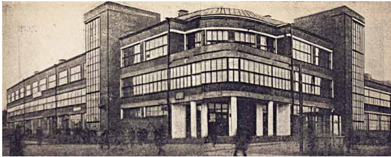
Фабрика-кухня «Нарпит № 2». Архитектор А.А. Журавлёв. Фотография. 1930-е гг.

круглыми люкарнами, а центральный фронтон увенчан крупным овальным окном. За время существования здания изменилось остекление эркеров, а совсем недавно потемневший от времени красный кирпич стен был покрашен розовой краской. На противоположной стороне улицы Батурина, в двухэтажной застройке начала XX века, выделяется еще один краснокирпичный жилой дом Горсовета того же архитектора (1928). В Иваново-Вознесенске было построено несколько десятков подобных жилых домов, в их облике отчетливо прослеживаются черты «краснокирпичного конструктивизма», ставшего отличительной чертой местной жилой архитектуры и сочетавшего в себе элементы как передовых авангардных течений, так и промышленного строительства. Для этих зданий характерны массивные объемы, красный кирпич в качестве основного материала и широкое остекление. В силу новизны типа жилого дома и участия в строительстве архитекторов со всей России, включая ведущих московских зодчих, в Иваново-Вознесенске возникла возможность реализации проектов с необычным расположением объемов и оригинальным планированием жилого пространства.