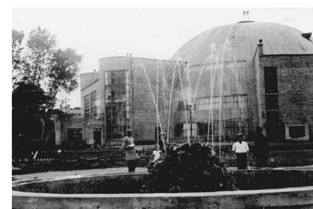
Цирк. Архитектор С.А. Минофьев. Фотография. 1930-е гг.