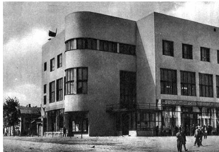
Сельскохозяйственный банк (Ивсельбанк). Архитектор В.А. Веснин. Фотография. 1930-е гг.

общественного питания, приближенной не только к месту работы, но и к жилищу. Поэтому значимой частью комплексов промышленных зданий с рабочими жилыми районами становились фабрики-кухни, которые не только выполняли функцию столовой, но и становились культурно-воспитательными центрами, так как в них предусматривались помещения для библиотеки и клуба. Одним из лучших образцов конструктивизма в Иваново-Вознесенске являлось здание фабрики-кухни «Нарпит № 2» (арх. А.А. Журавлёв; 1930–1933). Трехэтажная, г-образная в плане постройка с закругленным внешним углом подчиняется красным линиям пересекающихся улиц. Главный вход