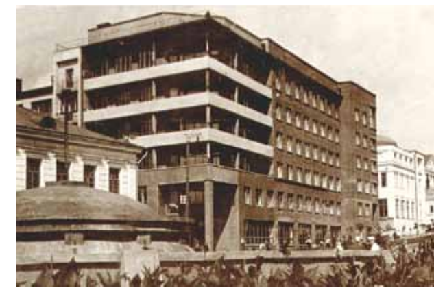
Гостиница «Центральная». Архитектор Д.В. Разов. Фотография. 1930-е гг.

К сожалению, в настоящее время большая часть строений постепенно меняет свой облик, ветшает и исчезает. Многие сохранившиеся здания представляют в большей степени не архитектурную, а историческую ценность. С 1974 года некоторые из имеющихся в Иваново объектов конструктивизма являются памятниками федерального значения. И очевидно то, что часть из них вполне могла бы претендовать на включение в список объектов всемирного наследия ЮНЕСКО.