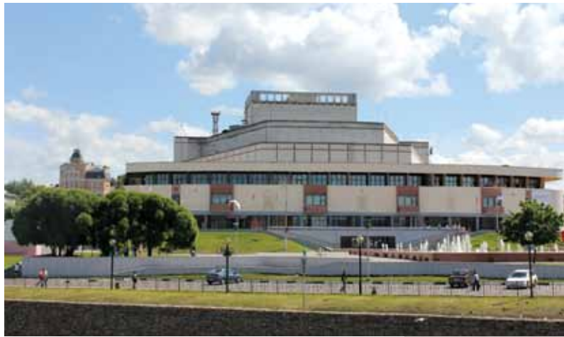
Ивановский областной драматический театр (Дворец искусств). Архитектор А.В. Власов.

Вверху: Фотография. 2000-е гг. Справа: Проектный вариант. 1932