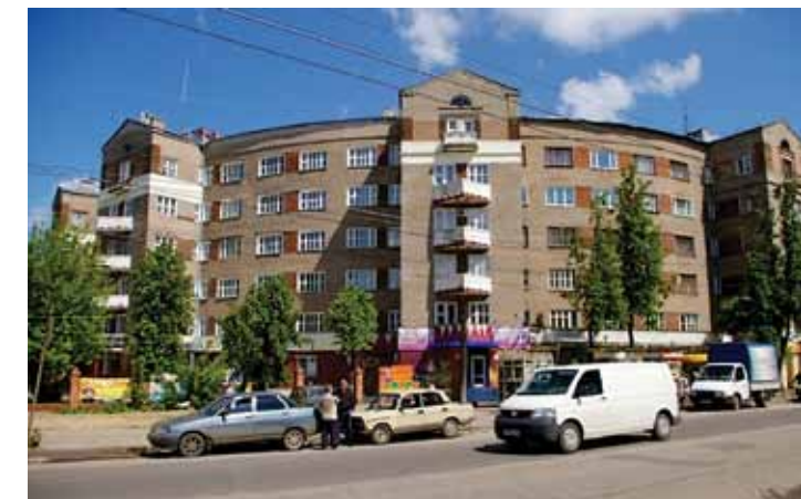
Жилой дом ОГПУ (Дом-подкова). Архитектор А.И. Панов. Фотография. 2000-е гг.