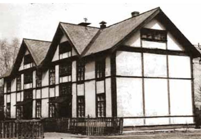
Дом в Первом рабочем поселке. Архитектор В.Н. Семёнов. Фотография. 1930-е гг.