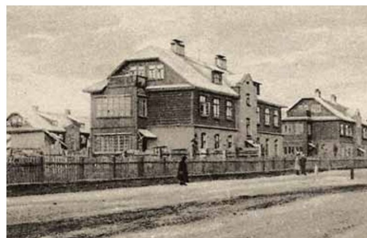
Второй рабочий поселок. Архитектор А.А. Стаборовский. Фотография. 1930-е гг.