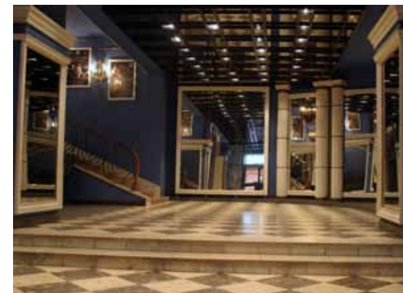
Московский государственный академический Камерный театр имени Б.А. Покровского. Фойе, вестибюль и фасад здания