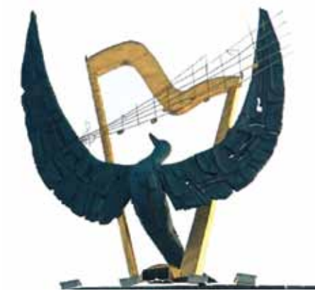
Московский Государственный Академический детский музыкальный театр имени Н.И. Сац.