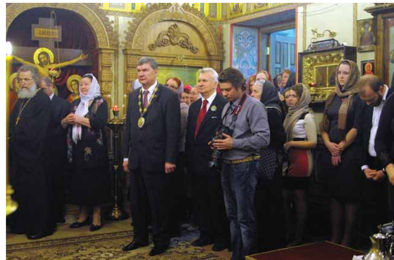
Литургия в Домовом храме Университета в день открытия Первых Рождественских чтений. 19 ноября 2013 г. Москва

Автор благодарит А.Г. Якушенко за предоставление иллюстраций для статьи.