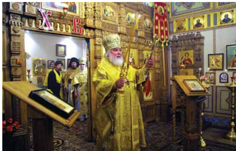
Литургия в Домовом храме Университета в день открытия Первых Рождественских чтений. 19 ноября 2013 г. Москва