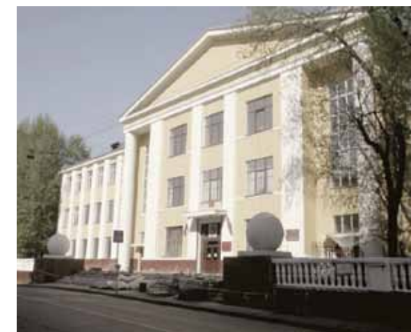
Государственный университет по землеустройству. Москва

В Год Аксакова в Уфе, в доме, в котором писатель провел раннее детство, был открыт, после бережной реставрации, его Мемориальный дом-музей. Экспозиция рассказывает, что Сергей Тимофеевич был долгожданным, вымоленным ребенком, названным в честь преподобного Сергия Радонежского. С детства он ощущал себя частью природы, знал и любил ее и до мелочей помнил все впечатления от дальних детских прогулок в лес или степь. На склоне лет Сергей Тимофеевич назовет природу «целителем» телесных и душевных недугов человека.