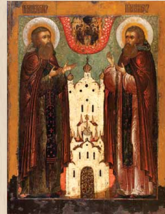
Икона «Преподобные Сергий и Никон Радонежские в молитве Святой Троице». Третья четверть XVII века. Центральная Россия. Собрание Ф.Р. Комарова