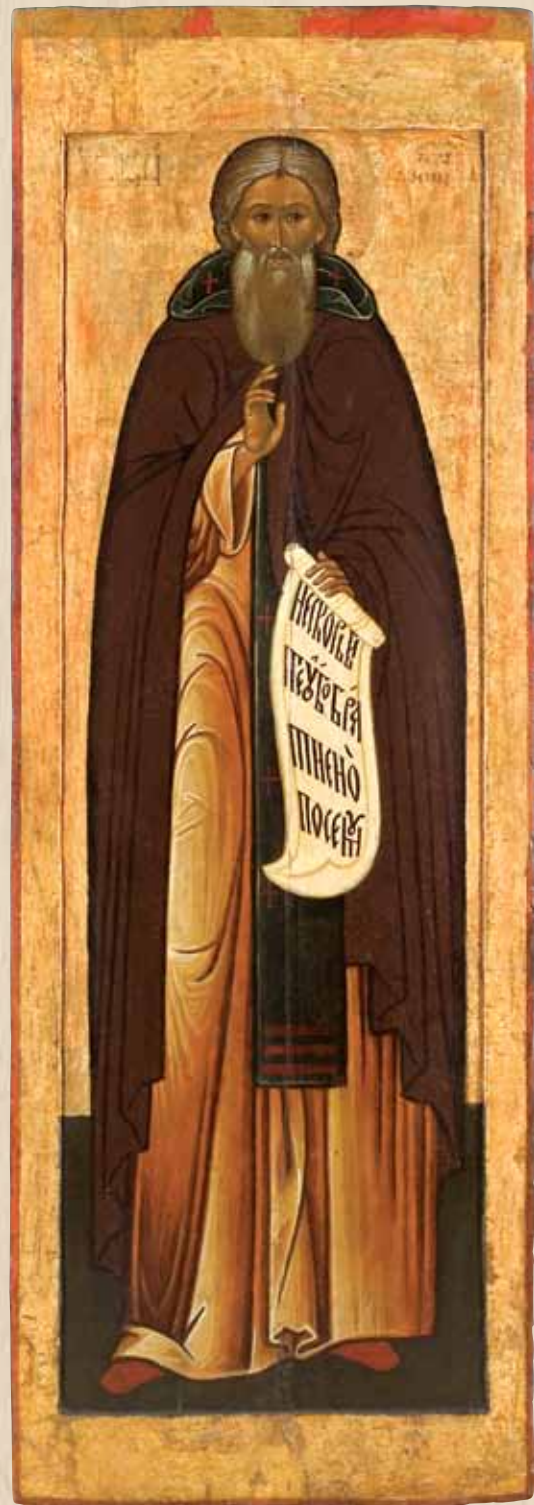
Икона «Преподобный Сергий Радонежский». 1610–20-е гг. Москва. Из Успенского собора в Дмитрове. Центральный музей древнерусской культуры и искусства имени Андрея Рублева. Москва