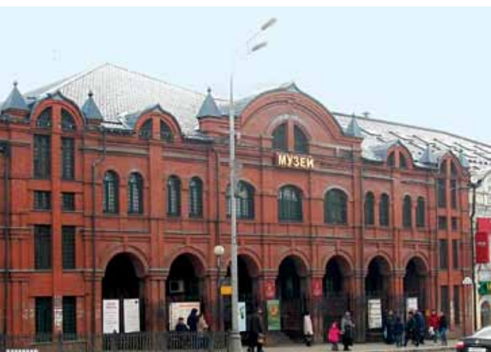
Главный корпус Сергиево-Посадского государственного историко-художественного музея-заповедника. Фотография. 2014

Сергиев Посад – город Преподобного Сергия, святого всех русских православных. В этом году Преподобному Сергию исполняется 700 лет – 700 лет чудес, связанных с его именем. Почти столько же лет (за вычетом проведенных Варфоломеем с семьей под Ростовым и в Радонеже) стоит основанный им, ставшим иноком Сергием, Троицкий монастырь, вокруг которого в 1782 году был юридически оформлен тогдашний посад с названием Сергиевский – нынешний Сергиев Посад. А в центре его – красавица «матушка Лавра», как образно и тепло определил ее в своем «Богомолье» Иван Шмелёв, или «русские Афины», по словам о. Павла Флоренского.