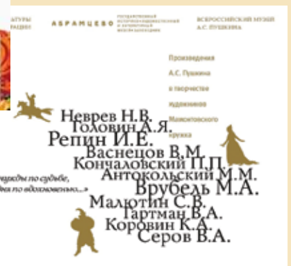
Афиши выставок музеев Сергиево-Посадского района. 2013–2014