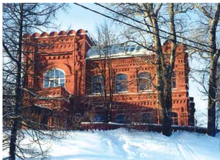
Художественно-педагогический музей игрушки. Фотография. Сергиев Посад. 2014

После революции Лавру закрыли. Учрежденная там Комиссия по охране памятников культуры и искусства подготовила открытие на ее территории в 1920 году музея; ныне – Сергиево-Посадский государственный историко-художественный музей-заповедник. Она же способствовала организации музея в бывшем имении Саввы Ивановича Мамонтова (а ранее – С.Т. Аксакова), в настоящее время это