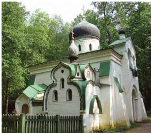
Церковь Спаса Нерукотворного. 1881–1882. Государственный историко-художественный и литературный музей-заповедник «Абрамцево». Фотография. 2014

странство, но также в других городах России и за границей. Совместные с другими музеями страны выставочные проекты неоднократно пользовались успехом у российских и зарубежных зрителей. Это «Русская народная игрушка» (Швейцария – Франция), «Хампельманн – матрешка: деревянная игрушка из Германии и России» (Германия – Россия), «Игрушки царских детей» (США), «В гостях у царской семьи» (Германия), «Не игрушки?!» (ГТГ), «Натюрморт. Метаморфозы. Диалог классики и современности» (ГТГ) и др.