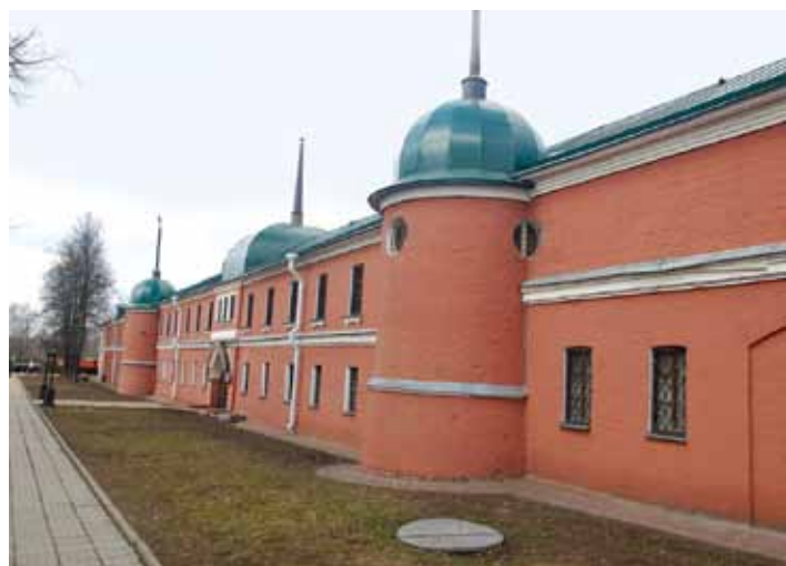
Музейно-выставочный комплекс «Конный двор». Фотография. Сергиев Посад. 2014

Если на выставке, посвященной Ивану III, среди 70 ее экспонатов было представлено, например, только одно произведение из Сергиева Посада – покровец на главу Преподобного Сергия Радонежского – сударь «Чудо Архангела Михаила в Хонех» (последний вклад Ивана III), то в Кижах экспонировалось 100 уникальных экспонатов из обширной музейной коллекции (ансамбли крестьянских женских костюмов, головных уборов, украшений и платков), что дало достаточно полное представление не только о бытовании и тради-