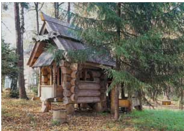
«Избушка на курьих ножках». 1883. Государственный историко-художественный и литературный музей-заповедник «Абрамцево». Фотография. 2013

На рубеже прошлого и нынешнего годов совместная экспозиция Музея игрушки, московского музея В.А. Тропинина и Самарского областного художественного музея состоялась на территории последнего. Она получила