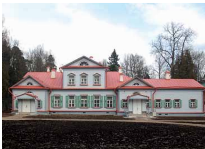
Усадебный дом. Конец XVIII–XIX в. Государственный историко-художественный и литературный музей-заповедник «Абрамцево». Фотография. 2014

Музей проводит большую выставочную работу, представляя публике экспозиции изо-