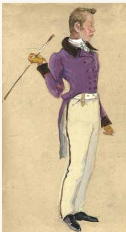
С.Н. Александров. Эскизы костюмов к спектаклям «Емельян Пугачев» (вверху: Хлопуша, Башкир) и «Ревизор» (внизу: Городничий, Хлестаков). Фонд им. П.М. Третьякова. Москва