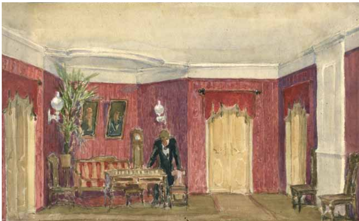
С.Н. Александров. Эскиз декорации к спектаклю «Последняя жертва». 1949. Бумага, акварель. 20x32. Фонд им. П.М. Третьякова. Москва