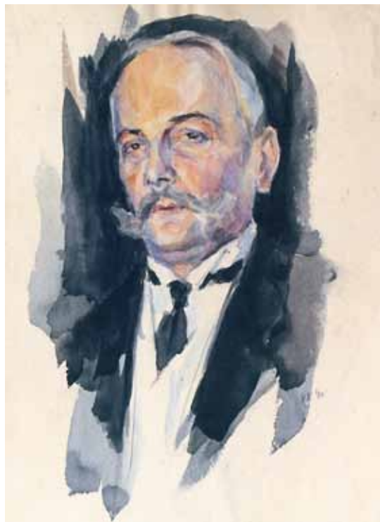
С.Н. Александров. Портрет народного артиста РСФСР В.И. Агеева. 1940. Бумага, акварель. 27,5x19. Фонд им. П.М. Третьякова. Москва

Весьма подкупающим биографическим фактом, считающимся для творческой личности