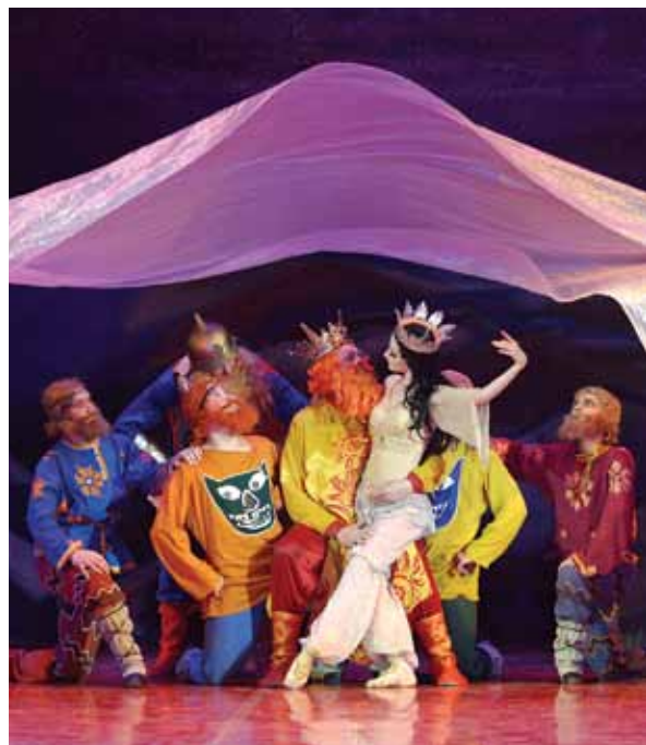
Сцена из спектакля «Золотой петушок»

можно говорить только так: в непосредственной близости друг к другу. И хорошо, что именно в пространстве Малой сцены проходят также концерты инструментального авторского цикла нашего главного дирижера Алевтины Иоффе.