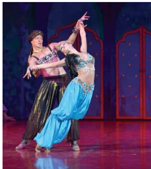
Сцена из спектакля «Шехерезада»

Еще одна тема, которая постоянно возникает, когда думаешь о нашем театре: здесь всегда – и сегодня – многое происходит либо