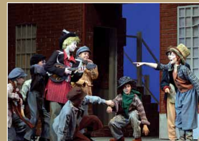
Сцены из спектаклей «Петрушка» (1), «Шехерезада» (2), «Золотой петушок» (3), «Жизнь и необыкновенные приключения Оливера Твиста» (4, 5)