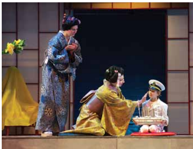
Сцены из спектаклей «Любовь к трем апельсинам», «Игра о Душе и Телe», «Мадам Баттерфлай (Чо-Чо-Сан)»

От тронного зала зрительского фойе расходятся в разные стороны тропки, по которым можно путешествовать. Вот буфет, но попадаешь в него не сразу, а только если пройдешь сквозь зеркальный коридор. А напротив зеркал – огромное живописное панно, стоит рояль, и на нем всегда кто-то играет. И при Наталии Ильиничне так было, и сейчас так. Потому что работает сама идея стоящих по всему зрительскому фойе музыкальных инструментов – роялей, пиано: на них всем хочется поиграть. Мне тоже. Еще поворот, лесенка, маленький пролет – Зимний сад с огромными, от пола до потолка, окнами, которые выходят во внутренний двор театра, где установлены фигуры неведомых зверей. Из Зимнего сада лестница наверх, таинственным полукругом, ведет в верхнее фойе с колоннами, между которыми можно бегать или рассматривать парящие над головой огромные скульптуры. В углу – столы для рисования, бумага, карандаши, и уже кто-то сидит и рисует. Опять идея, которая не исчерпывает себя: низкие детские столы, маленькие стульчики, цветные карандаши в стаканчиках и белая бумага. Все это было придумано уже тридцать, если не сорок, лет назад. Именно здесь придумано, в Театре Наталии Сац.