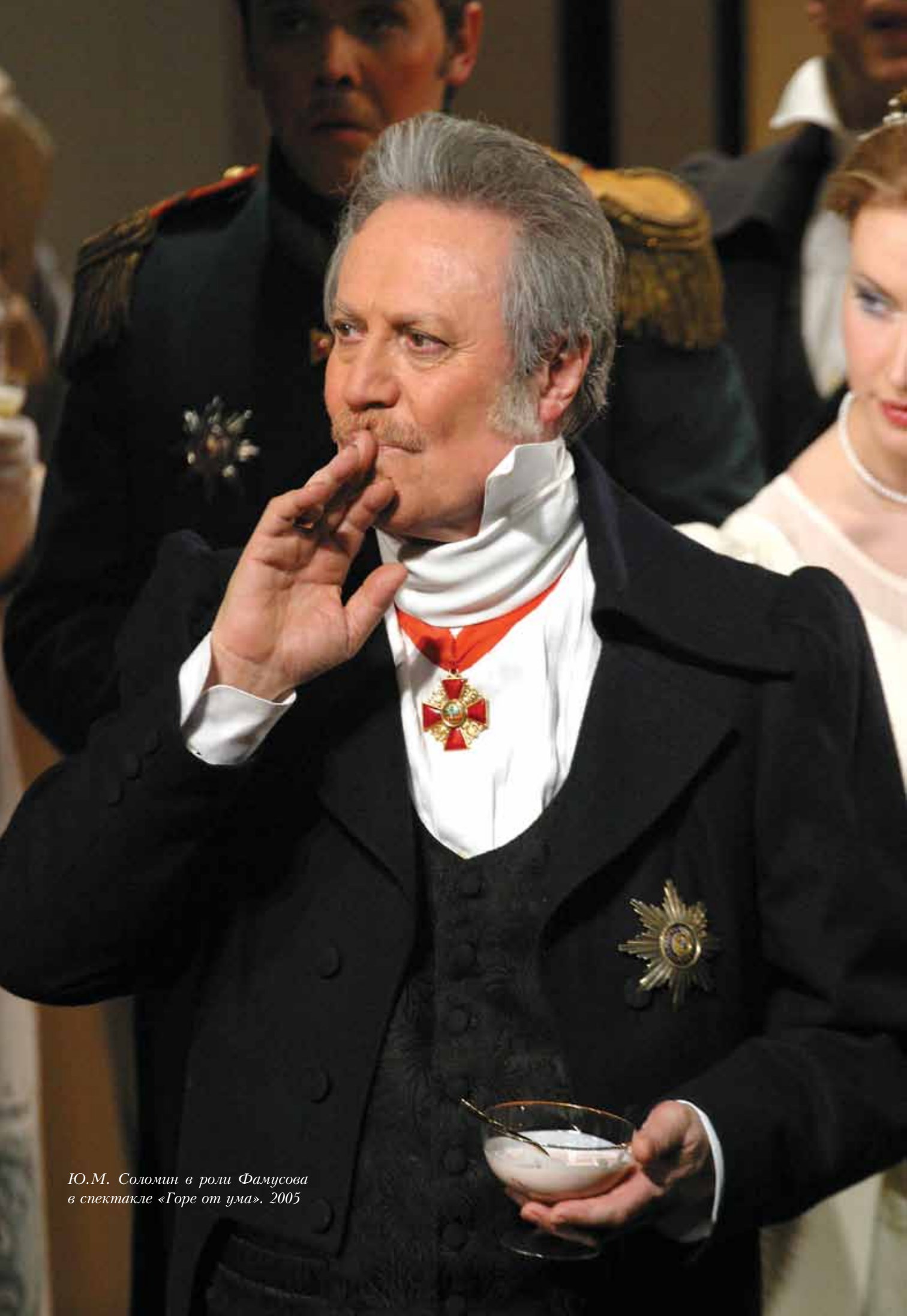
Ю.М. Соломин в роли Фамусова в спектакле «Горе от ума». 2005