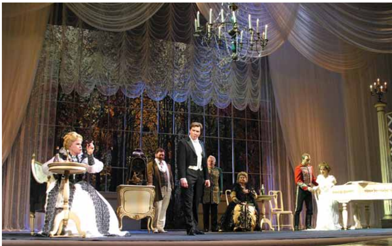
Сцена из спектакля «На всякого мудреца довольно простоты». Художник Э.Г. Стенберг. 2002

Е.В. Малый – это государственный академический театр России. Каким смыслом для Вас наполнено каждое из этих значимых слов?