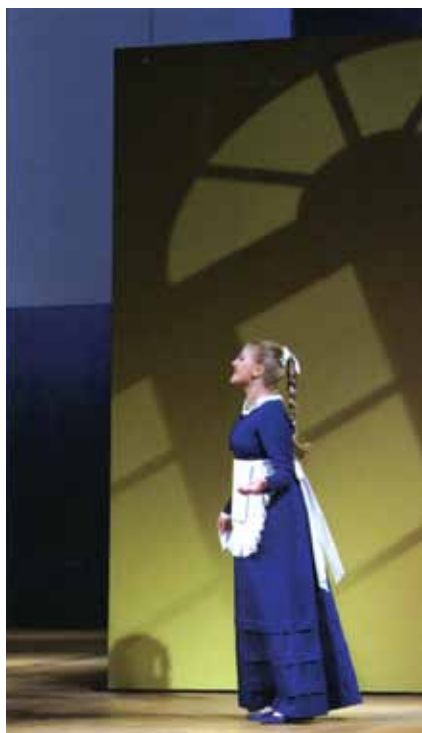
Сцена из спектакля «Горе от ума». Художник А.Д. Боровский. 2000