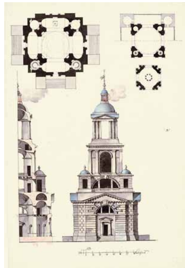
Н.А. Львов. Проект церкви с колокольней. 1790-е гг. Бумага, тушь, акварель. 48,5x32,8. Государственный научно-исследовательский музей архитектуры им. А.В. Щусева. Москва