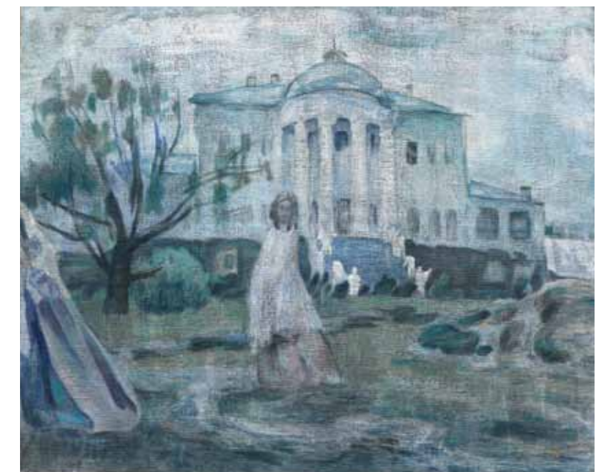
В.Э. Борисов-Мусатов. Призраки. 1903. Холст, темпера. 117, x144, 5. Государственная Третьяковская галерея. Москва

Последним проектом архитектора, осуществленным уже после его смерти, стала церковь