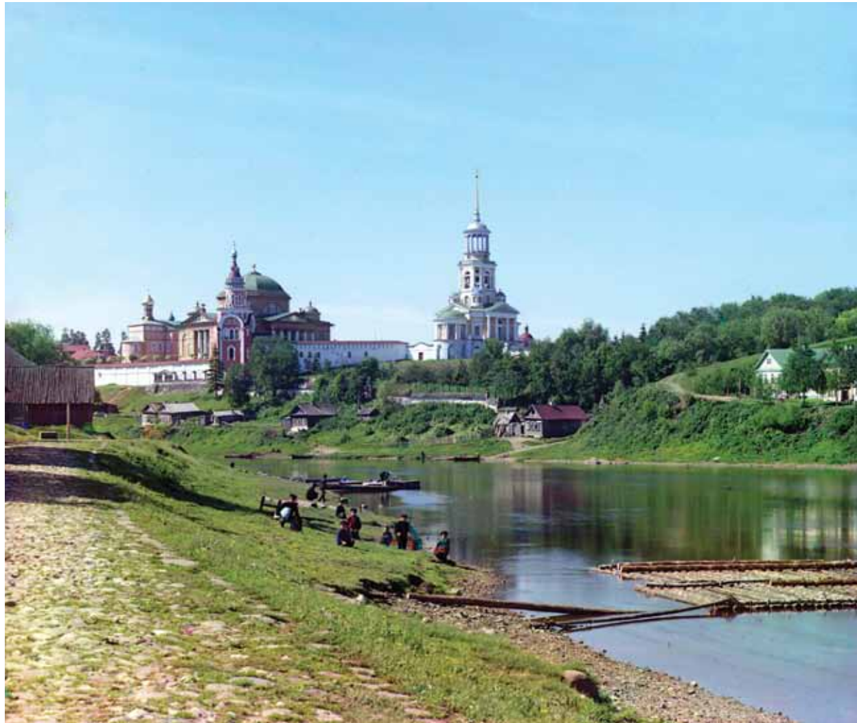
С.М. Прокудин-Горский. Борисоглебский монастырь с моста. Торжок. 1910. Цветная фотография с трех негативов. 8x9. Библиотека Конгресса США. Вашингтон

первых государственных бесплатных общеобразовательных школ, в которых, помимо прочих дисциплин, преподавалась и архитектура. На фронтисписе, лично выгравированном Львовым, помещено аллегорическое изображение Перспективы, справа от которой, за приподнятой амуром драпировкой, открывается вид на окруженный сверканием могилевский собор Св. Иосифа, здесь особенно явно напоминающий виллу Ротонда – светлую цель учения крестьянских детей.