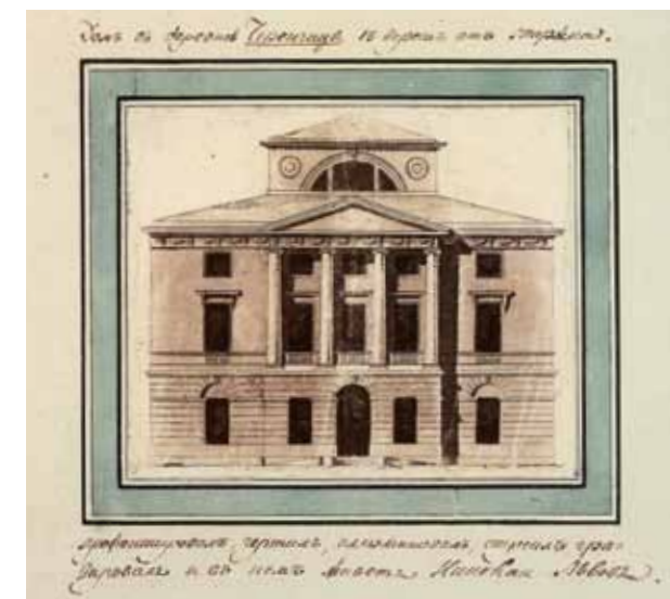
Н.А. Львов. Дом в усадьбе Никольское-Черенчицы. Главный фасад. 1780-е гг. Офорт, акварель, надпись тушью. Алушкинский дворцово-парковый музей-заповедник

Конечно, облик усадебных построек не был изобретением Львова. Внешний вид и даже планировка усадебного дома восходили к опубликованному в «Четырех книгах» Палладио проекту виллы Рагона с добавлением мотивов, напоминающих английский Чизик-хаус и камероновский Павловск. Храм-ротонда и вовсе кажется сошедшим со страниц Палладиева трактата. Все же парковые «затеи» наследуют паркам английских палладианцев, трудам Хиршфельда и прочим европейским прототипам. Однако главное во львовской усадьбе, которой он дал собственное имя, переименовав в Никольское, даже не архитектура или садовое искусство, но царящая повсюду атмосфера домашнего уюта и особое, трогательное очарование привольной сельской жизни молодого поэта. Львову не хватает денег на достройку дома в камне, но он не может отказать себе в удовольствии возвести на берегу искусственного пруда очередную ротонду или выстроить сарай периптером – в этом явное отличие Никольского от монументальной суровости вилл Палладио или холодной элегантности английских парков. Даже крепостное право не кажется здесь формой рабства: крепостные живут бок о бок с хозяином, а античные портики, как некогда мечталось Палладио, осеняющие