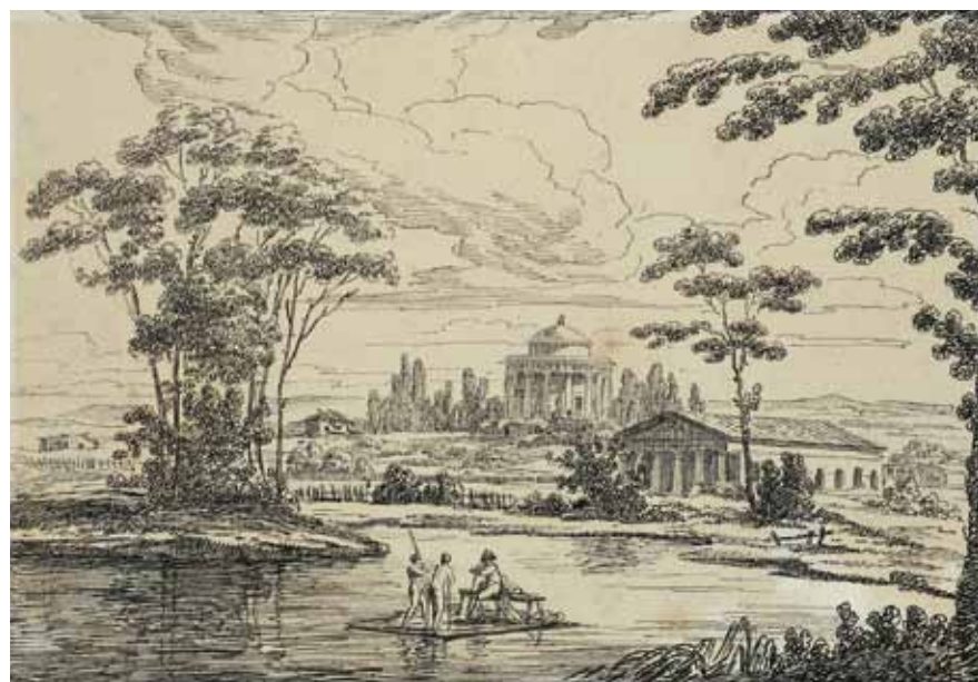
М.Н. Воробьев. Вид села Никольского. 1812. Бумага, тушь, перо. 18,8x26,3. Государственная Третьяковская галерея. Москва

Пожалуй, наиболее эффектен особняк в усадьбе Знаменское-Раёк неподалеку от Торжка. В центре знакомая палладианская схема: компактный двухэтажный дом с четырехколонным портиком и бельведером под круглым куполом, фланкированный полукруглыми галереями. Однако, в отличие от вилл Палладио, галереи эти не прерываются, но тянутся