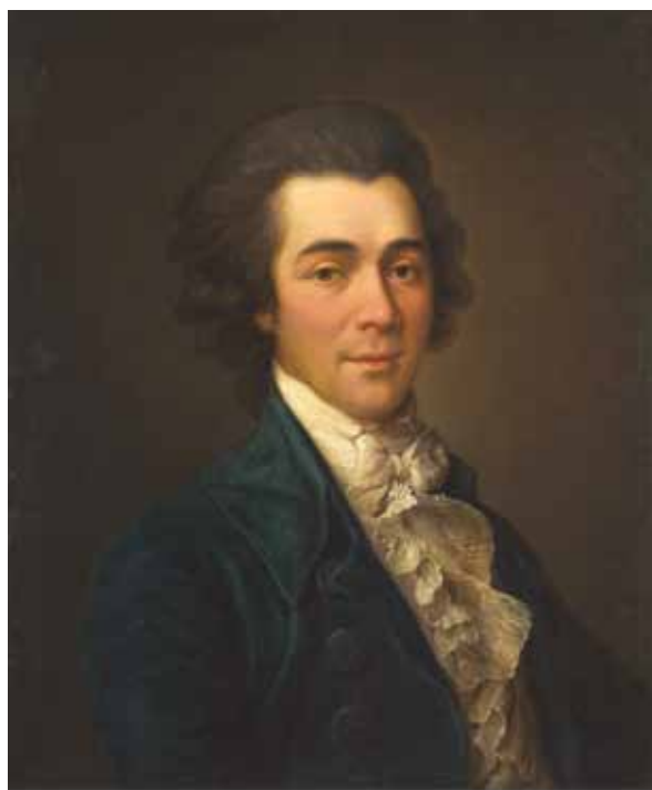
Д.Г. Левицкий. Портрет Николая Александровича Львова. 1789. Холст, масло. 71x55,5. Государственная Третьяковская галерея. Москва

Нам не известно ни одного здания, построенного Львовым в 1770-е годы. По всей видимости, архитектура была не самым значительным его интересом. По словам биографа, «Он любил и стихотворство, и живопись, и музыку, и архитектуру, и механику. Словом, он был любимое дитя всех художеств, всякого искусства» 2 . Никакого профессионального образования ни в одном из искусств, впрочем, Львов не получил. Более всего, пожалуй, его занимала поэзия и вообще сочинительство. Львов стал членом литературного кружка, в который входили ведущие поэты эпохи – Державин,