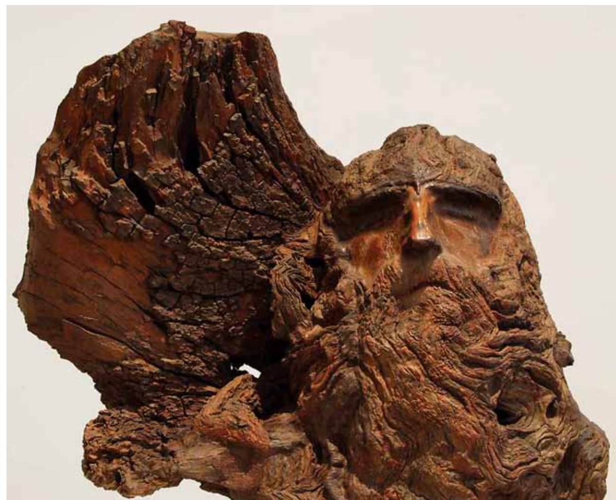
С.Д. Эрзя. Александр Невский. Дерево (кебрачо). 49x79x46. Мордовский республиканский музей изобразительных искусств им. С.Д. Эрзи. Саранск

Четвертое измерение скульптуры – время. Сквозь его призму все ярче сияет звезда Маэстро, которому было подарено счастье рассказать нам о нас, показать, как велик и прекрасен может быть мир и человек в нем.