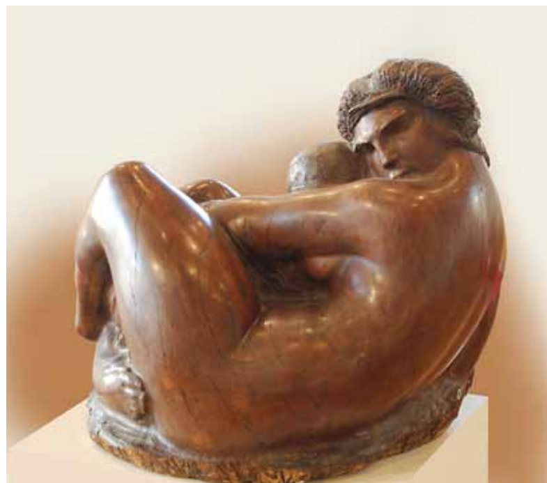
С.Д. Эрзя. Мать с ребенком. 1929. Дерево (кебрачо). 48x57x38. Мордовский республиканский музей изобразительных искусств им. С.Д. Эрзи. Саранск