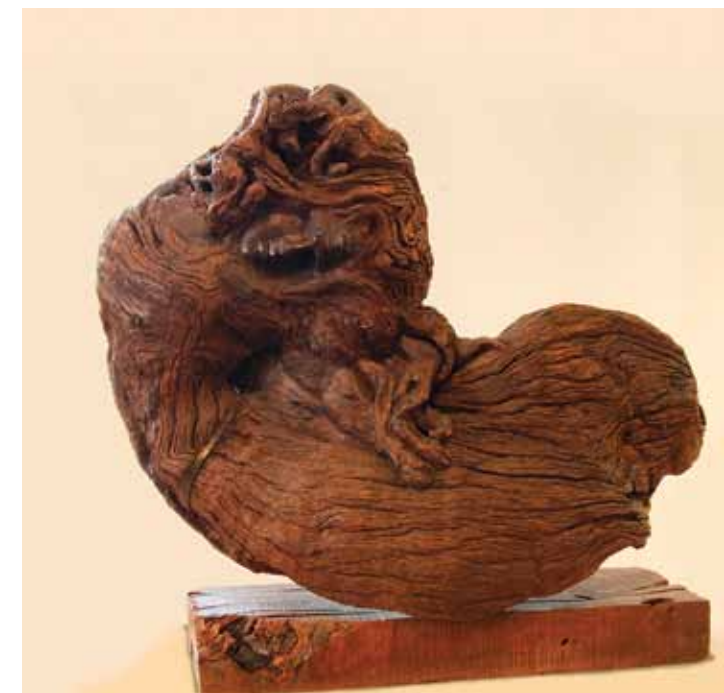
Мордовский республиканский музей изобразительных искусств им. С.Д. Эрзи. Саранск