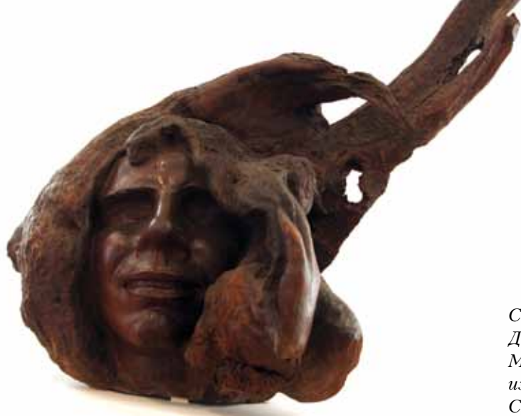
С.Д. Эрзя. Портрет матери. Дерево (урундай). 137x140x79. Мордовский республиканский музей изобразительных искусств им. С.Д. Эрзи. Саранск

Маэстро продолжает напряженно и плодотворно работать, он перестает быть главным действующим лицом художественной жизни Буэнос-Айреса. Скульптор живет затворником в своей мастерской в окружении 30 кошек и любимой собаки, ухаживает за растениями, пьет чай из сосновых почек, изредка позволяет себе посидеть в кафе Tortoni.