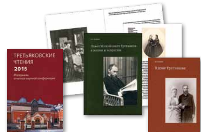
Издательские проекты Фонда 2012–2016 годов

Доказательством жизнеспособности любой структуры является наличие потенциала для роста и развития. У Фонда он проявился очень быстро, и в орбиту разноплановой деятельности один за другим стали попадать замечательные региональные музеи. Фонд не только осваивает Россию от Москвы до самых до окраин, но и пересекает границы отечества. Среди многочисленных «мостов дружбы», связывающих Россию с Францией и Грецией, Италией и Грузией, есть и те, что наведены талантами и стараниями людей, которых объединяет в большую дружную семью Фонд имени Третьякова. Ближе всех к России оказалась ее самая дальняя «соседка» по Европейскому континенту — Португалия: участие в неделях русской культуры, организуемых Россотрудничеством и посольством России, в международном фестивале искусств «Вера», проводимом в Лиссабоне, открытие на острове Мадейра кабинета имени Карла Брюллова... Необходимость показать миру подлинную Россию, помочь людям узнать