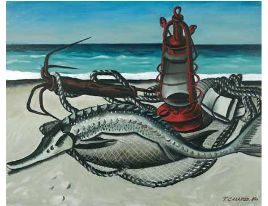
Т.Т. Салахов. Утренний улов. 1984. Холст, масло. 80x110. Международная конфедерация союзов художников. Москва