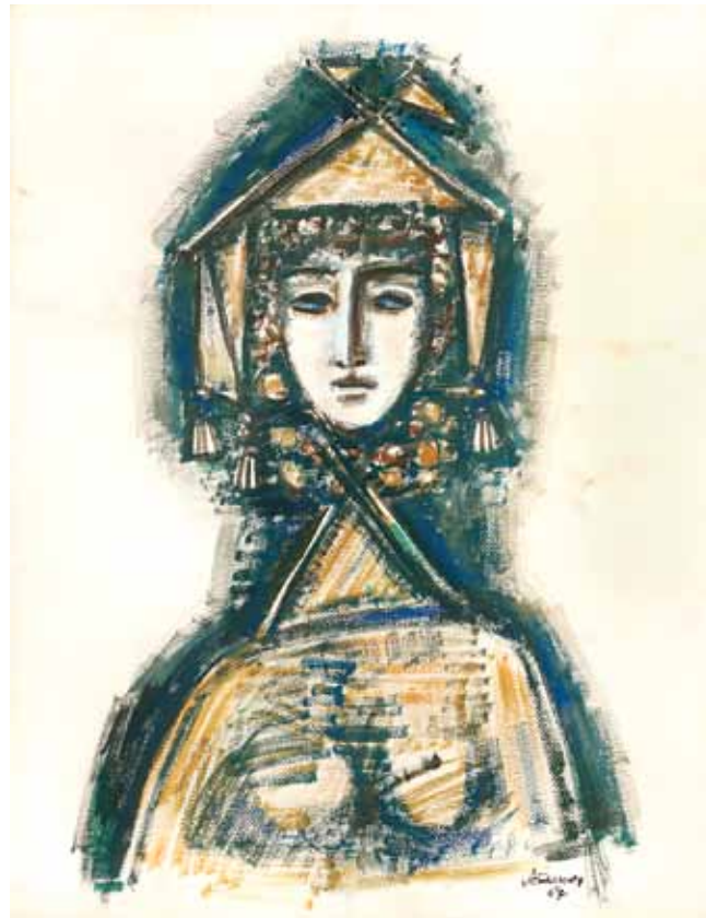
А.Г. Тышлер. Женская голова. 1967. Бумага, гуашь, акварель. 60x40. Международная конфедерация союзов художников. Москва

разбросанную в разных частях Москвы, собрать в одном месте, оборудовав соответствующим образом помещение для хранения художественных ценностей. На все это ушло время и значительные затраты. В течение нескольких лет цель была достигнута.