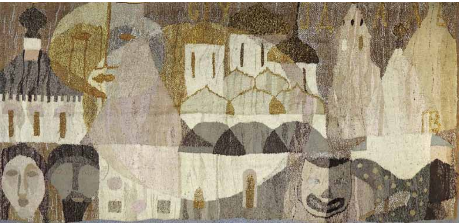
В.И. Платонова. Суздаль. 1970-е гг. Шерсть, лен, аллюнит, ручное ткачество. 170x360. Международная конфедерация союзов художников. Москва

По размеру и масштабам коллекция Конфедерации сопоставима с собраниями картин таких авторитетных музеев, как Государственная Третьяковская галерея или Русский музей, а собрания региональных музеев решительно превосходит. Подлинная уникальность коллекции Конфедерации выражается в том, что это един-