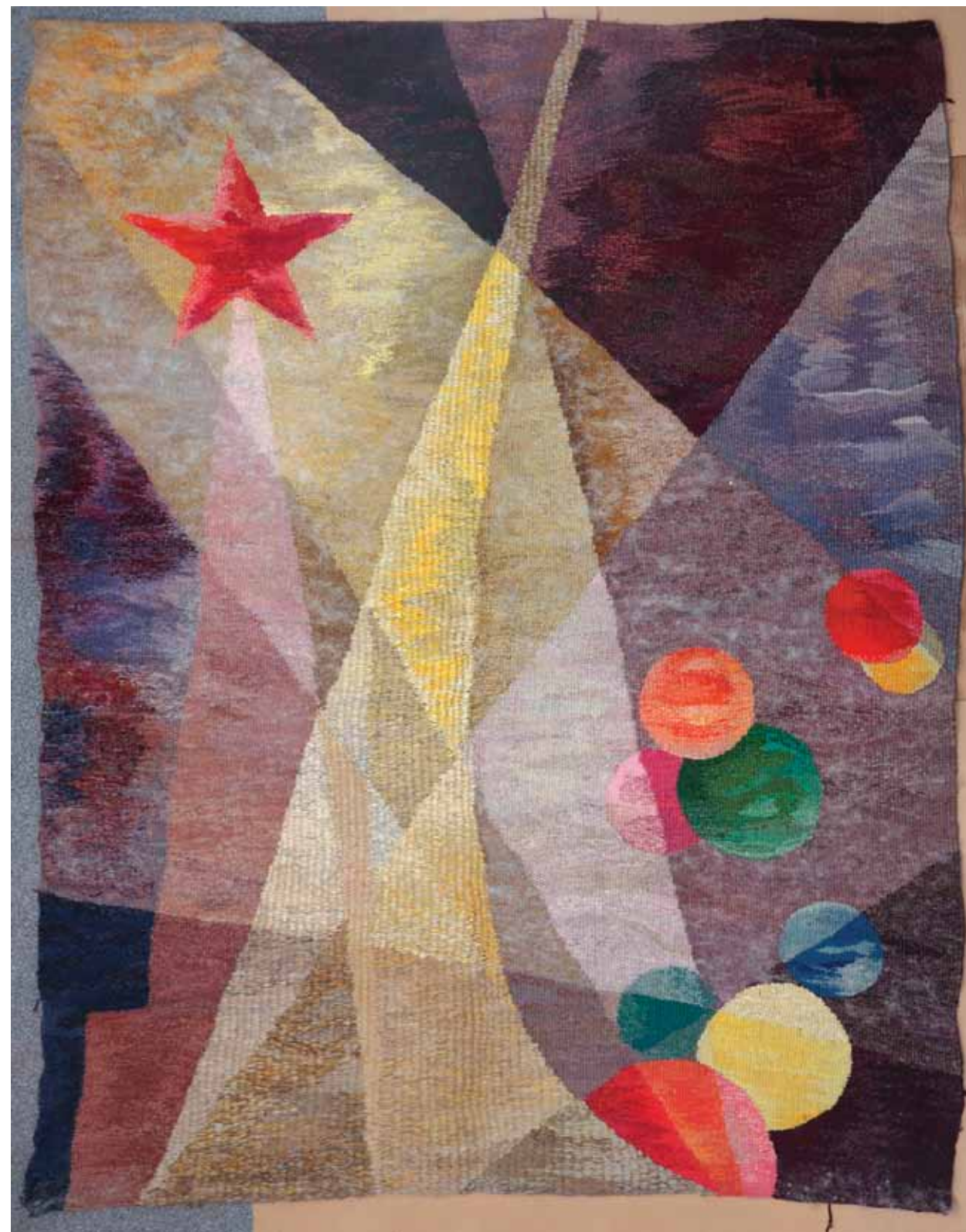
Н.В. Кирсанова. Победа . 1975. Шерсть, ручное ткачество. 250x200. Международная конфедерация союзов художников. Москва