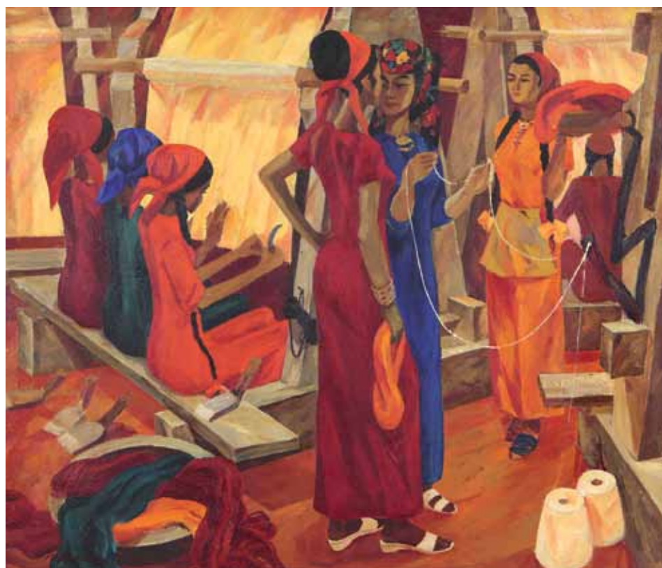
И.Н. Клычев. Ковровицы . 1974. Холст, масло. 130x150. Международная конфедерация союзов художников. Москва

классики – Шекспира, Мольера, Лопе де Вега, Толстого, Достоевского, Горького, Булгакова, Вампилова и многих других выдающихся драматургов. Здесь представлены эскизы мэтров театрально-декорационного искусства – Вадима Рындина, Валерия Левенталя, Давида Боровского, Сергея Бархина.