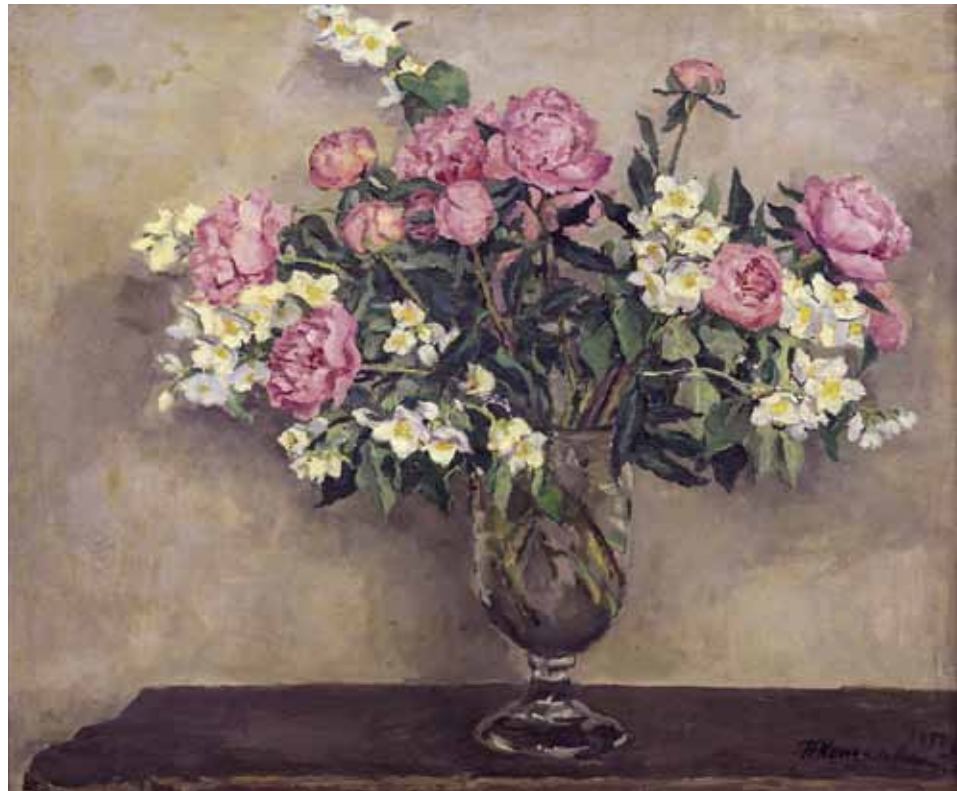
П.П. Кончаловский. Натюрморт с цветами. 1950. Холст, масло. 74x87. Международная конфедерация союзов художников. Москва

ственное подробное собрание работ художников из бывших союзных республик. И в ряде случаев (особенно это коснулось стран Балтии) в новых независимых государствах нет ведущих работ выдающихся национальных художников, а у нас – есть. Их представители даже ставили вопросы о “возвращении”, но ввиду того, что работы были в свое время приобретены у авторов совершенно законно, эти просьбы отклонили. Основа такого положения, конечно, в самых истоках МКСХ, когда было принято четко сформулированное решение о неделимости и передаче всей коллекции СХ СССР в собственность Международной конфедерации».