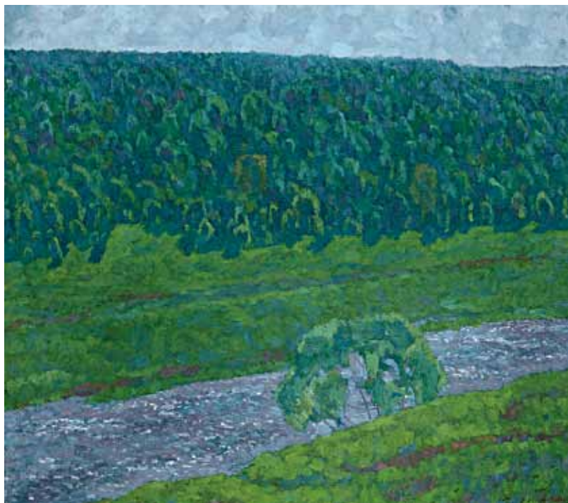
Е.И. Зверьков. Зеленый май. 1972. Холст, масло. 100x110. Международная конфедерация союзов художников. Москва