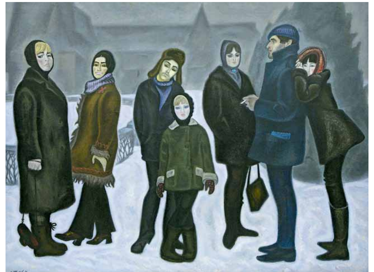
В.Е. Попков. Зимние каникулы. 1972. Холст, масло. 150x200 Международная конфедерация союзов художников. Москва