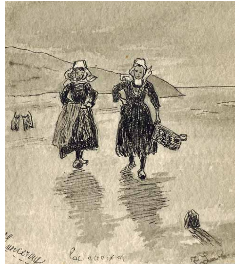
З.Е. Лансере (Серебрякова). На побережье. 1896. Бумага, тушь, перо, кисть. 15x11,5. Архив семьи Зеленковых. Санкт-Петербург