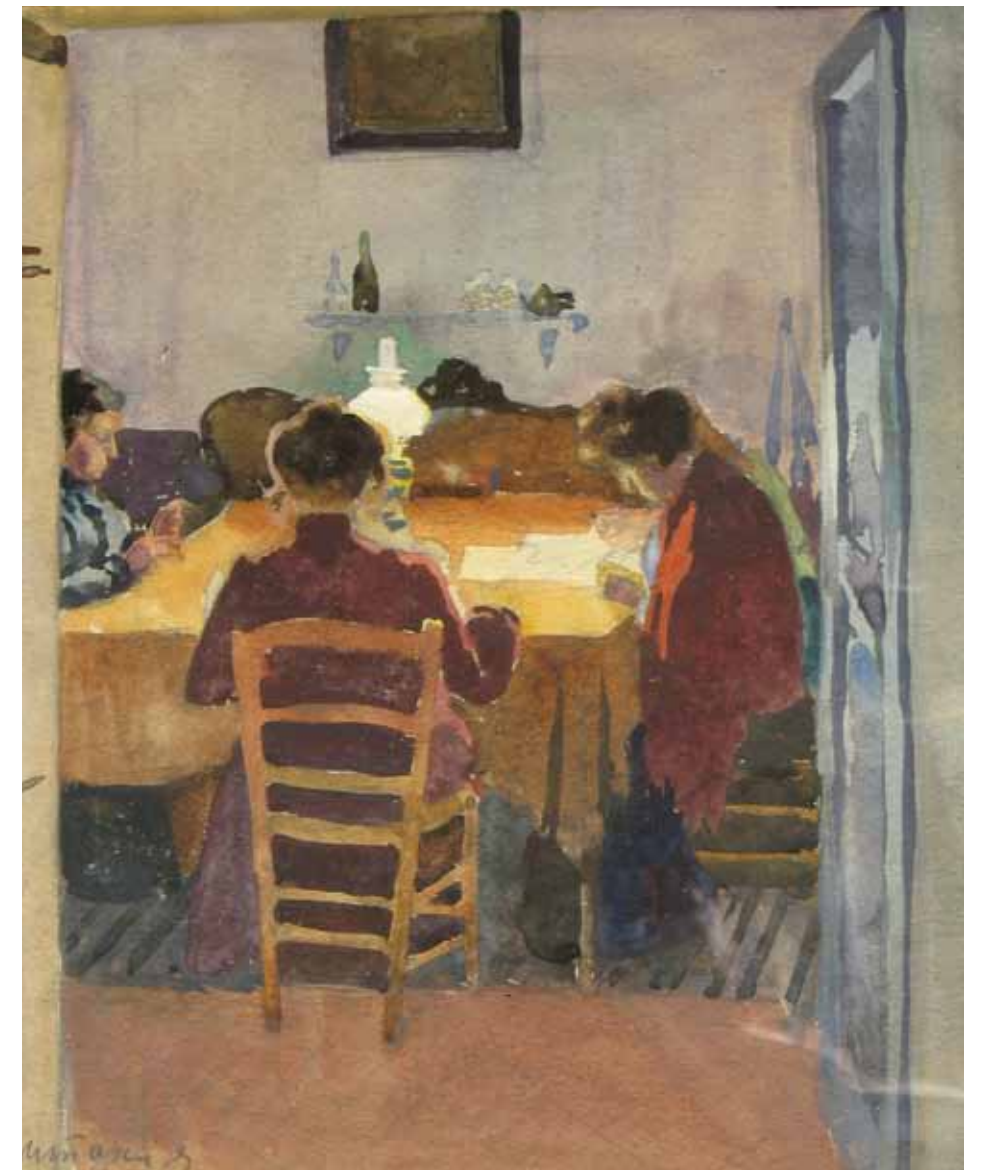
З.Е. Серебрякова. Нескучное. Бумага, гуашь. 30x25.