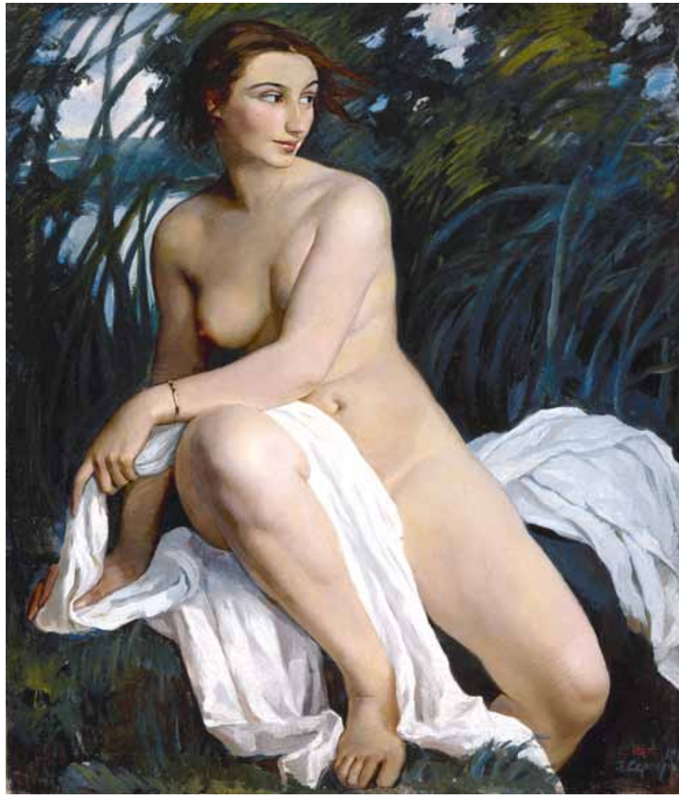
З.Е. Серебрякова. Купальщица. 1911. Холст, масло. 98x89.

щицы. Но, как и все искусство в эту эпоху, «Купальщица» не конкретный образ Екатерины Евгеньевны, а скорее символический. Опираясь на искусство античности и эпохи Возрождения с их культом прекрасного человека, Зинаида Евгеньевна стремилась отобразить вечные эстетические ценности. Ей удалось создать жизненное и одновременно романтическое изображение молодой женщины. Теплые краски передают полнокровность тела модели, которое четко выделяется на фоне холодных оттенков травы и неба. Женщина кажется словно светящейся изнутри. Все на картине приведено в движение: бегущие облака, склоняющаяся под ветром трава, развевающиеся волосы купальщицы. В «Купальщице» передана сияющая радость обнаженного женского тела – Вечной Женственности.