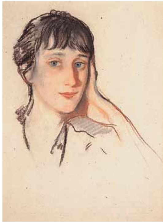
З.Е. Серебрякова. Портрет Анны Ахматовой. 1922. Бумага, пастель, уголь, сангина. 45,5x36. Музей Анны Ахматовой в Фонтанном Доме. Санкт-Петербург

зами дети и юные женщины, благородные лица мужчин, сочные вспаханные поля и крестьяне... и во всем, что исходило из-под кисти Зинаиды Евгеньевны, струился радостный и благодный свет земного Бытия.