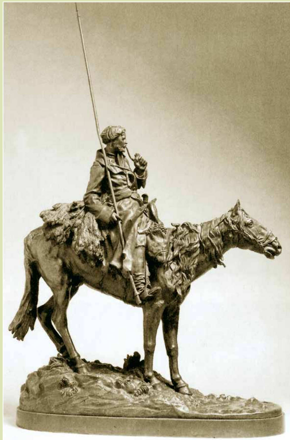
Е.А. Лансере. Казак в степи. 1870-е гг. Бронза. Высота 51 см. Государственная Третьяковская галерея. Москва