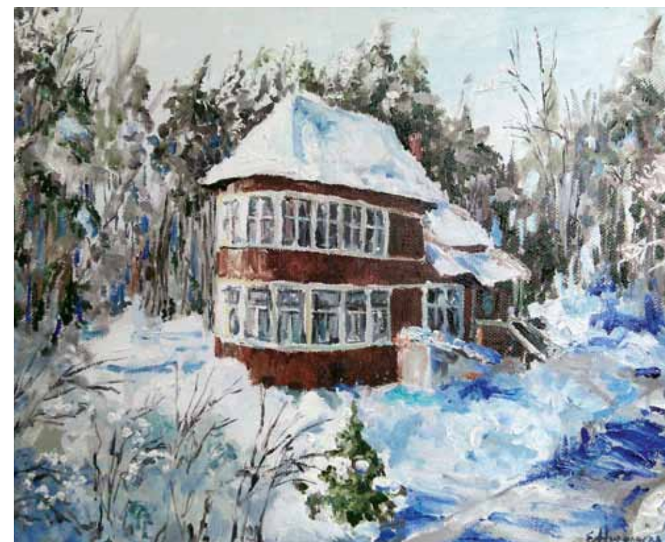
Е. Серебрякова-Николаева. Дача Пастернака в Перedelкинe. 2017. Холст, масло. 40x50. Коллекция Махаринских. Великобритания