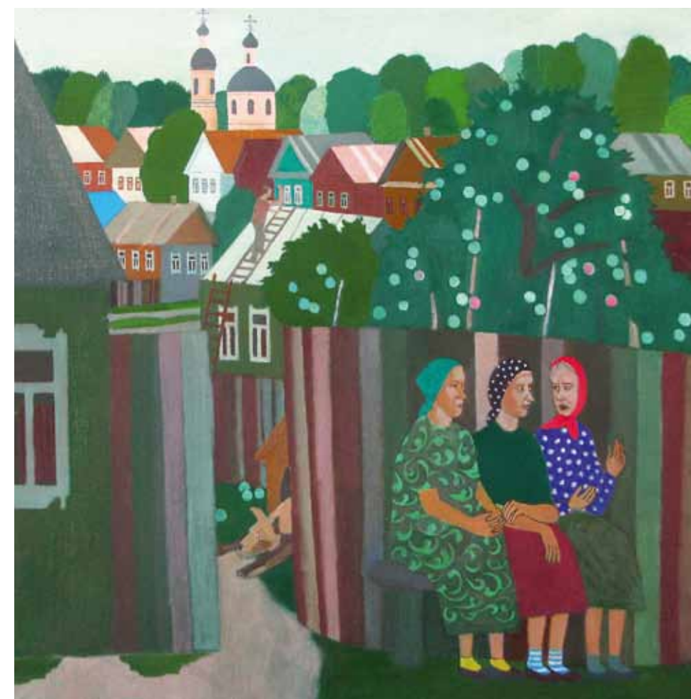
А. Крайнюков. Понедельник. 2014. Холст, масло. 107x107. Коллекция лорда Роберта Скидельски. Великобритания