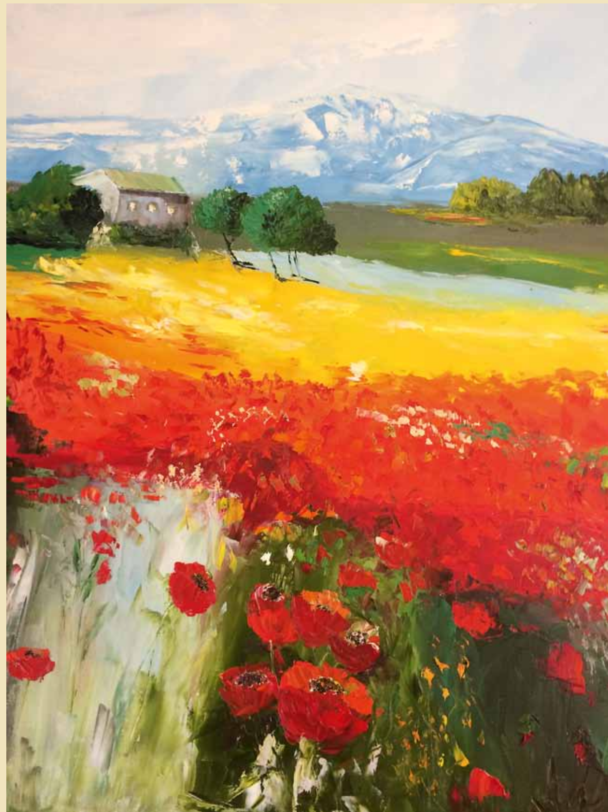
А. Никифорова. Горы цветов. 2014. Холст, масло. 90x80. Представительство ООН в Москве

Ключевые слова: Благотворительный фонд «Помощь отечественному искусству», Ольга Адамишина, молодые российские художники, зарубежные коллекции.