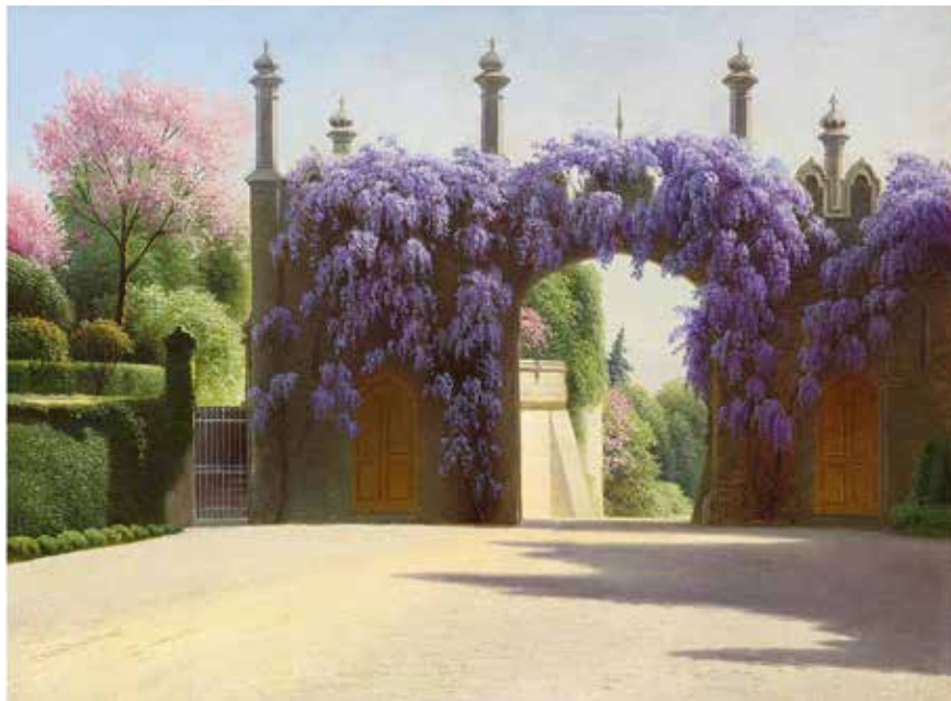
Г.П. Кондратенко. Крымский пейзаж. Въезд в Алупкинский дворец. Последняя четверть XIX – первая половина XX века. Холст, масло. 50х67. Алупкинский дворцово-парковый музей-заповедник

торского имения в Ореанде. Ялте присвоили статус города.