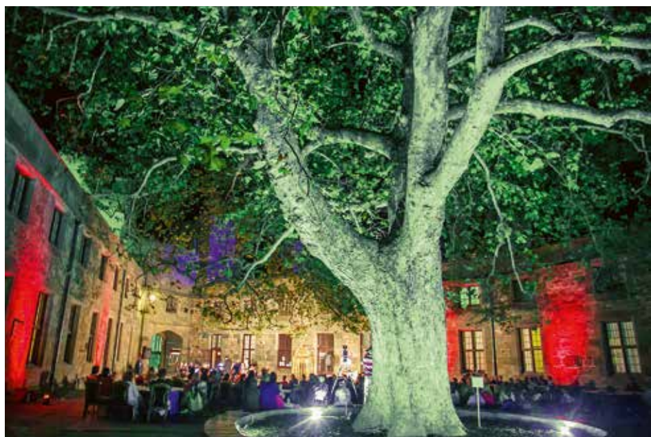
Концерт из цикла «Под сенью воронцовского платана». 2016

Уже несколько сезонов подряд у нас проходит цикл концертов «Под сенью воронцовского платана», который дарит жителям и гостям полуострова незабываемые вечера классической музыки. Все организовано под эгидой Министерства культуры Республики Крым в сотрудничестве с Алупкинским музеем-заповедником и Крымской государственной филармонией. В прошлом году запущен проект «Театра таинство под башней часовой», с успехом выступали артисты Крымского академического русского драматического театра имени М. Горького. На территории ансамбля проводятся разноплановые научные мероприятия, конференции и международные форумы, молодежные слеты и симпозиумы. С нашими дорогами друзьями – ведущими сотрудниками музеев-заповедников «Царское Село», «Царицыно», «Петергоф», «Ясная Поляна» и других, мы проводим интересные выставки. Участвуем в самых разнообразных проектах, реализуемых как с музеями (выставка «Романовы. Воспоминания о Крыме» сейчас экспонируется в Царицыне), так и с благотворительными органи-