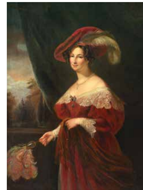
Л. Дессиме с оригинала Г. Хейтера. Портрет Елизаветы Ксаверьевны Воронцовой, урожденной Браницкой. 1840-е годы. Холст, масло. 141,7x103,5. Алупкинский дворцово-парковый музей-заповедник

А.Б. Здесь мы вновь обращаемся к личности Михаила Семеновича. До 18 лет он воспитывался в Англии (где его отец был дипломатом) получил блестящее образование, знал много языков и культур разных стран. Построив дворец в Алупке, Воронцов тем самым воздвиг памятник мастерам своего дела – русским каменщикам и английским архитекторам, итальянским скульпторам и немецким садовникам... Это памятник человеческому гению, а не отдельно взятой личности.