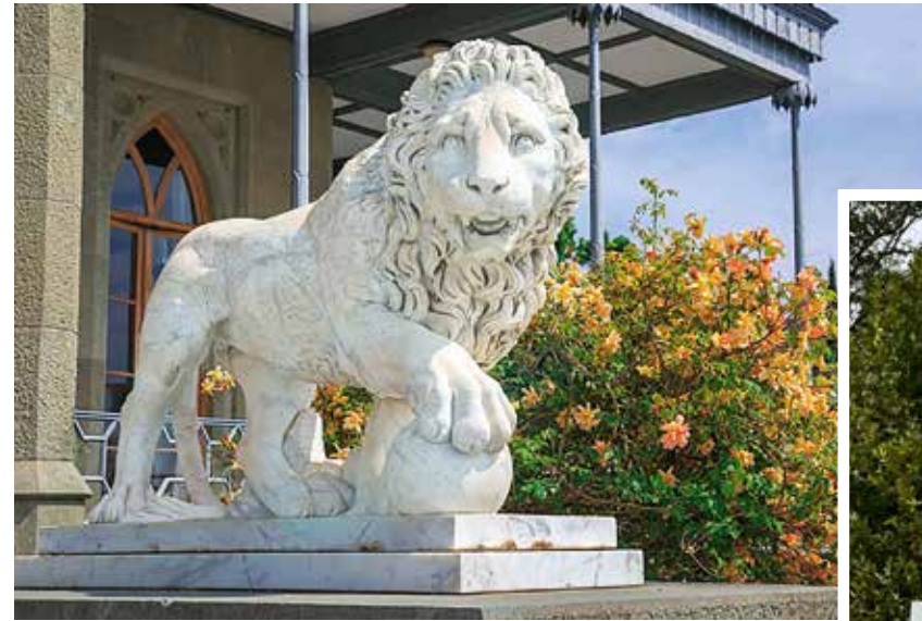
Мастерская Бонанни. Лев бодрствующий. Лев спящий. Мрамор. 1840-е годы. Алушкинский дворцово-парковый музей-заповедник. Фотографии М.Д. Аветисян. 2021

А.Б. На строительстве было занято большое количество людей. На данный момент известно только около 300 имен. Привлекались в основном опытные потомственные мастера – каменотесы и камнерезы, зарекомендовавшие себя на отделке белокаменных соборов. Они использовали простые орудия труда и все делали вручную. В одном из парадных залов му-