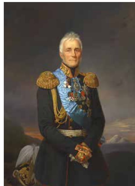
Ф. Крюгер. Портрет светлейшего князя, фельдмаршала М.С. Воронцова. 1856. Холст, масло. 141x102,6. Алупкинский дворцово-парковый музей-заповедник

Одно из любимых детищ графа – дворец и парк в Алупке. Большой ценитель искусства, он собрал обширную художественную коллекцию, включавшую множество картин, скульптур, предметов декоративно-прикладного творчества. Воронцовы владели южным имением до 1920 года. Некоторые сотрудники, работавшие там при Воронцовых, своими силами продолжали охранять его от посягательств, однако возникла еще одна угроза. В имении был создан совхоз «Алупка», что означало неминуемое распыление оставшихся произведений искусства. Но уже в ноябре 1920 года Крымский революционный комитет (Крымревком), обладавший всей полнотой власти, взял под охрану и национализированные имения. В том же 1920 году был создан Крымский областной комитет по делам музеев и охране памятников старины, искусства, природы и народного быта (КрымОХРИС), который и занялся выявлением и учетом ценностей для дальнейшего создания музеев и формирования музейных собраний. Именно действия КрымОХРИСа воспрепятствовали расхищению и продаже ценностей. В феврале 1921 года В.И. Ленин направил председателю Крымревкома телеграмму: «Примите решительные меры к охране художественных ценностей, находящихся в ялтинских дворцах...», что существенно укрепило позицию комитета и расширило возможности КрымОХРИСа. Уже в марте 1922-го Алупкинскому дворцу присвоили юридический статус музея. Богатейшее собрание Воронцовых и частично присоединенных к нему коллекций из бывших царских и великокняжеских дворцов Крыма