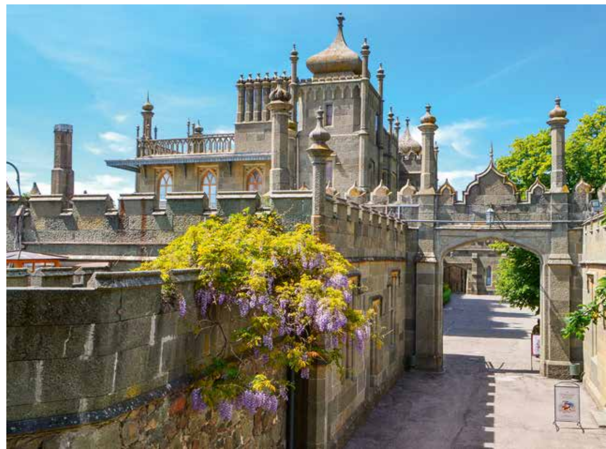
Вход в северный Парадный двор с восточной стороны. 2017

ями (выставка «Мне мило отвлеченное», подготовленная совместно с Фондом имени П.М. Третьякова, прошла на нашей территории в 2021 году).