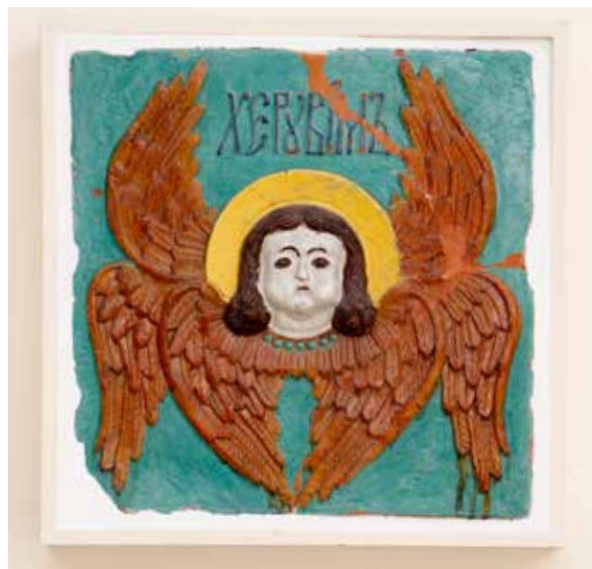
Изразец фасадный с изображением херувима. Степан Иванов (Полубес). Начало 1680-х годов. Глина, эмали цветные; формовка, роспись, обжиг. 50x50x10. Московский государственный объединенный музей-заповедник

Вселенских Соборов Данилова монастыря и евангелиста Матфея из храма Святого Стефана за Яузой.