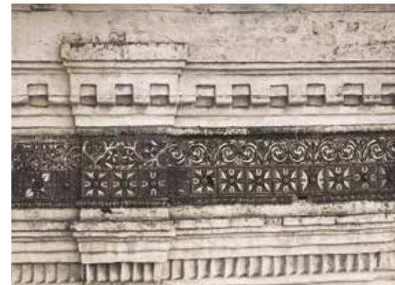
Керамические иконы на храме Святых Отцов Семи Вселенских Соборов Данилова монастыря. 1920-е годы

В 1666 году патриарха Никона лишили сана, а мастеров из Ново-Иерусалимского монастыря перевели в Оружейную палату Московского Кремля. В столице постепенно сформировались свои центры произ-