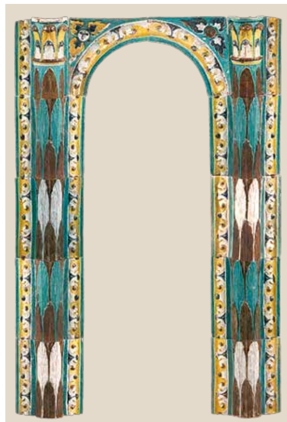
Изразцовый наличник храма Святой Параскевы Пятницы в Охотном ряду. 1686. Глина, эмали цветные; формовка, роспись, обжиг. 167x104x19. Московский государственный объединенный музей-заповедник

В залах экспозиции можно увидеть комплекс изразцового декора церкви Адриана и Наталии (1688). Она получила наименование по приделу, а основной объем был посвящен апостолам Петру и Павлу. Храм располагался в Мещанской слободе (от польского – mieszczanin – горожанин), где проживали выходцы из Польши и Литвы,