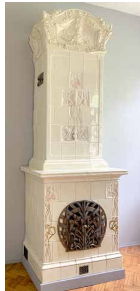
Печь. Мейсен, Германия. После 1879 года. Глина, эмали цветные; формовка, роспись, обжиг. 314x125x76. Московский государственный объединенный музей-заповедник

Материалы попали в музей различными путями. Например, известна история поступления керамической надписи, находившейся на колокольне храма Адриана и Наталии в Мещанской слободе. После разбора памятника в музей Всесоюзной академии архитектуры 27 февраля 1937 года было направлено письмо с просьбой о приобретении изразцов: «В связи с устройством в текущем году музеем “Коломенское” выставки по истории русской строительной керамики музею желательно получить облицованную изразцами главу и изразцовую надпись о построении с бывшей церкви Адриана и Наталии на 1-й Мещанской улице... Директор Никитин 27.2.1937» 4 . Ответ пришел уже через несколько дней: «Музей Архитектуры не возражает против получения Вами облицовочной изразцами главки и изразечной надписи о построении церкви Адриана и Наталии. Об изъятии и ассигновании на указанные работы Вам надлежит установить связь с Московским