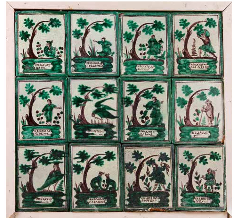
Панно с сюжетными изразцами. Москва. XVIII век. Глина, эмали цветные; формовка, роспись, обжиг. 69x72x10. Московский государственный объединенный музей-заповедник