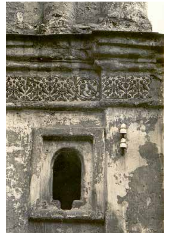
Фрагмент изразцового фриза колокольни храма Николая Явленного на Арбате. 1920-е годы Московский государственный объединенный музей-заповедник