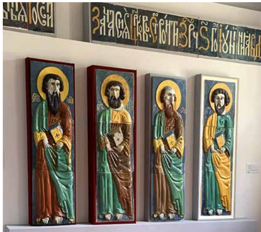
Фрагмент экспозиции «Открытое хранение. Печи и изразцы»:

Фрагмент керамической надписи. 1689. Располагалась на колокольне храма Адриана и Наталии в Мещанской слободе