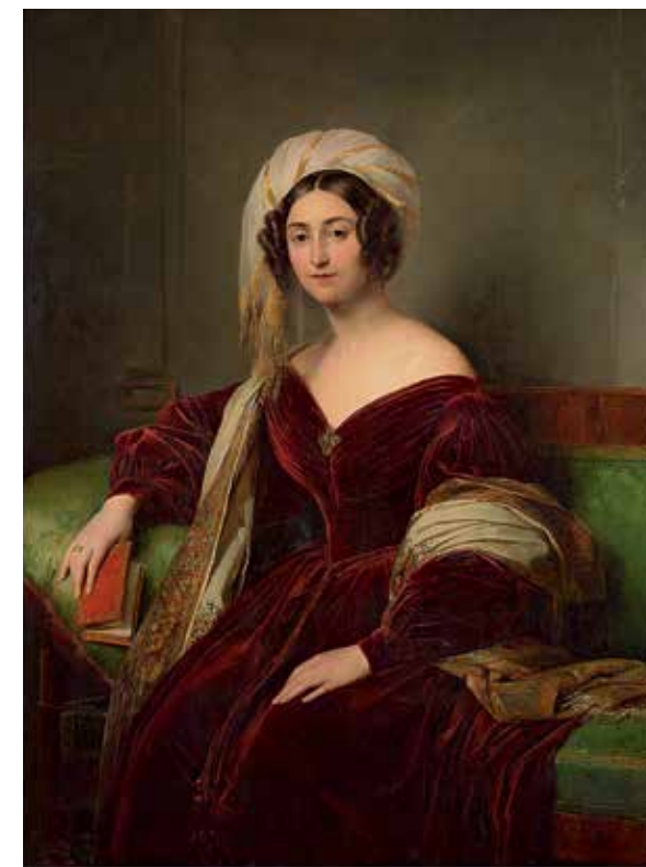
Неизвестный художник середины XIX века. Портрет неизвестной. 1840-е годы. Холст дублированный, масло. 132,4x99. Государственная Третьяковская галерея. Москва

На самом деле всегда стараюсь выклеивать макет в бумажном виде. Например, выставку Боголюбова открываем осенью 2023 года. Куратор передает список – я тут же говорю, что очень много произведений, надо сокращать. Сделав маленькие