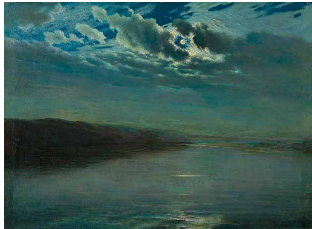
Н.А. Ярошенко. Ночь на Каме. 1884. Холст, масло. 74x101,6. Государственная Третьяковская галерея. Москва

Сейчас мы готовим вторую часть выставки, на которой представим бытовой жанр, виды городов, интерьеры и скульптуру (от мастеров XVIII века до современных, поскольку на первой экспозиции показывали только А.С. Голубкину). Это снова будут малоизвестные интересные разновременные произведения. Возникнут сопоставления. Например, сравним икону с изображением Кремля и храма Василия Блаженного с работами А.М. Васнецова и А.В. Лентулова, Красную площадь – у К.П. Бодри и В.В. Кандинского, а также образ Колизея у А.М. Матвеева, С.М. Воробьева и Т.Т. Салахова. Пока что удалось найти несколько таких соединений, чтобы «взбодрить» экспозицию.