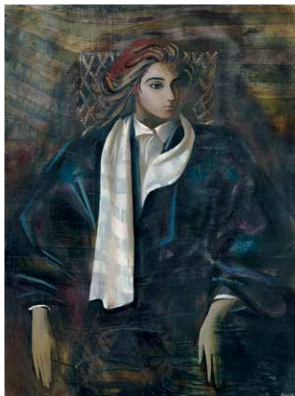
А.Т. Салахова. Портрет Иры. 1987. Холст, масло. 160x120. Государственная Третьяковская галерея. Москва