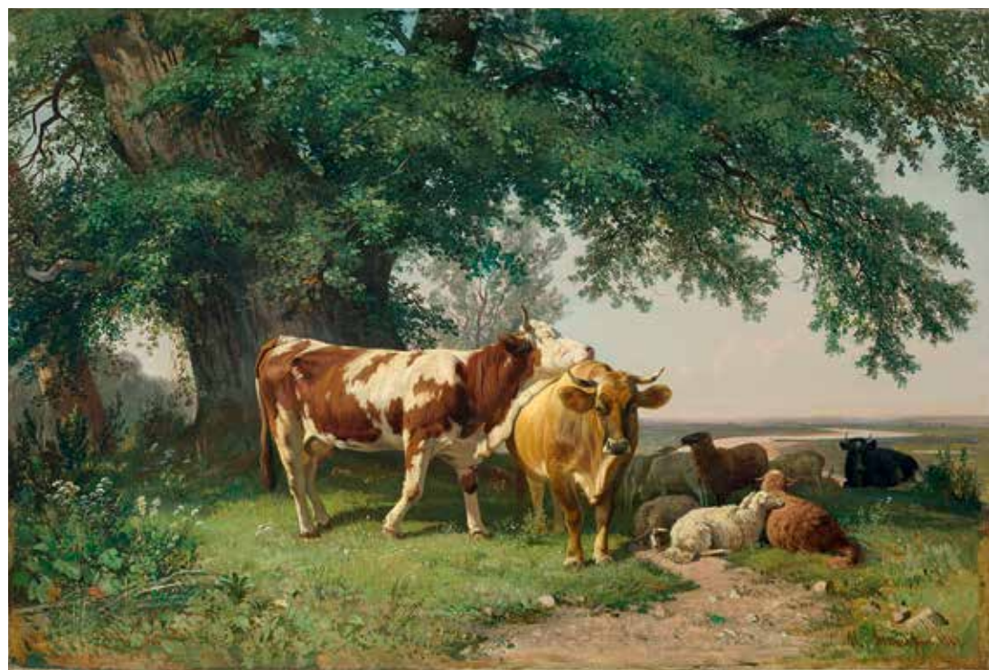
И.И. Шишкин. Стадо под деревьями. 1864. Холст, масло. 72x107. Государственная Третьяковская галерея. Москва

При обсуждении названия проекта решили: раз он – отражение сайта «Моя Третьяковка», то это должно быть в заголовке. Также необходим подстрочник, объясняющий, что представлено на выставке. Тем более предполагался баннер без изображения картин, только QR-код. Тогда родилось: «Из виртуального в реальное». Почему? Посетитель при осмотре экспозиции может использовать смартфон и, считывая QR-код, попадает на онлайн-платформу, где узнает информацию о художнике или сюжете, заинтересовавшем на выставке. Нам показалось, что такая современная технология будет воспринята зрителями, они обрадуются обилию информации, которую получают помимо экспликации и аннотационного материала.