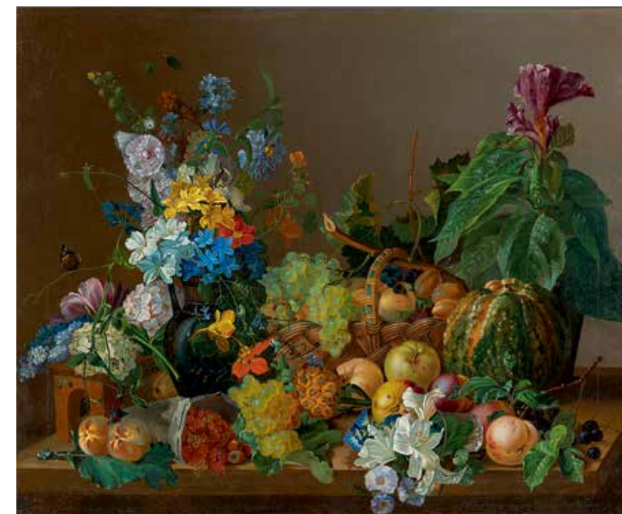
Ф.Г. Торопов. Натюрморт. 1840-е годы. Холст, масло. 81,5x99,5. Государственная Третьяковская галерея. Москва