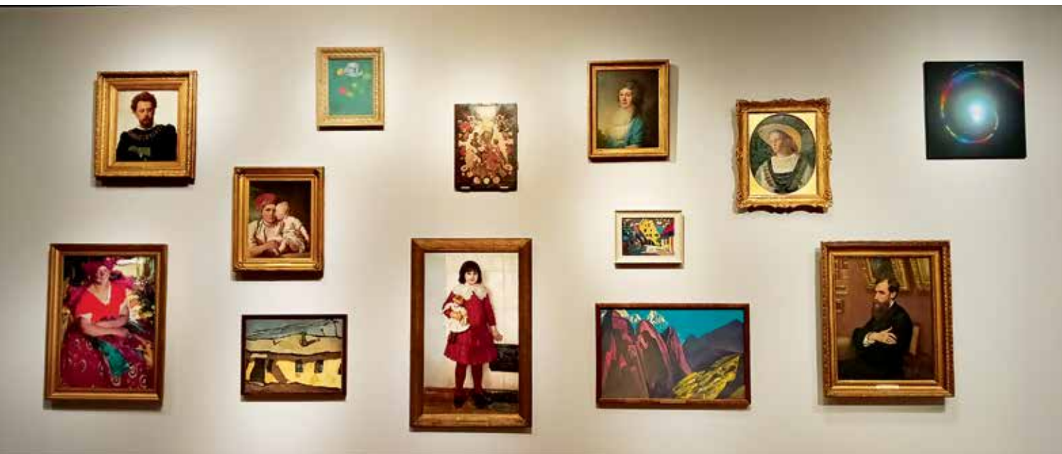
Титульная стена выставки «Моя Третьяковка. Из виртуального в реальное». Ноябрь 2022 года

цветные изображения, выкладываю по темам. В макете становится хорошо видно, какие произведения наиболее выигрышно работают друг с другом. Далее обсуждаю с куратором: «У нас есть определенная площадь. Как бы мы ни построили этот зал, сможем уместить только конкретное количество произведений. Какие убираем?» Так шаг за шагом отрабатывается экспозиция. Я глазом вижу точнее в напечатанном, наклеенном виде. Таким образом, новые технологии совмещаю с «дедовскими» методами.