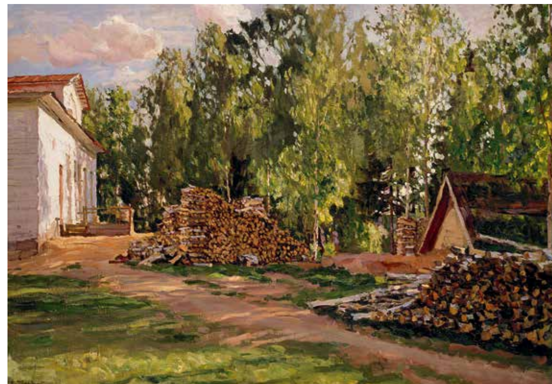
С.Ю. Жуковский. Усадьба. Двор. Вторая половина 1900-х годов. Холст, масло. 71,2x98,2. Государственная Третьяковская галерея. Москва

Должна сказать, что мы ошиблись в названии, потому что люди его не понимают. Однажды, проходя по вестибюлю музея, была свидетелем разговора: «А что там такое?» – «Какая-то виртуальная выставка». И это стало большим огорчением: мы потратили много сил, чтобы сделать проект быстро и качественно. Выставка получилась цельная, более того – очень комфортная. Но, к сожалению, посетителей сегодня мало. Хотелось бы донести до зрителя: экспозиция наполнена действительно замечательными произведениями! Например, художник В.И. Суриков. При этом имени встают перед глазами картины «Боярыня Морозова», «Утро стрелецкой казни», «Меншиков в Березове» – хрестоматийные произведения, а здесь посетители увидят его акварель – изумительный натюрморт «Букет». Или И.И. Левитан, творчество которого представлено итальянскими пейзажами и даже Мариной. Если пройти по всем разделам – масса интересных и неожиданных работ.