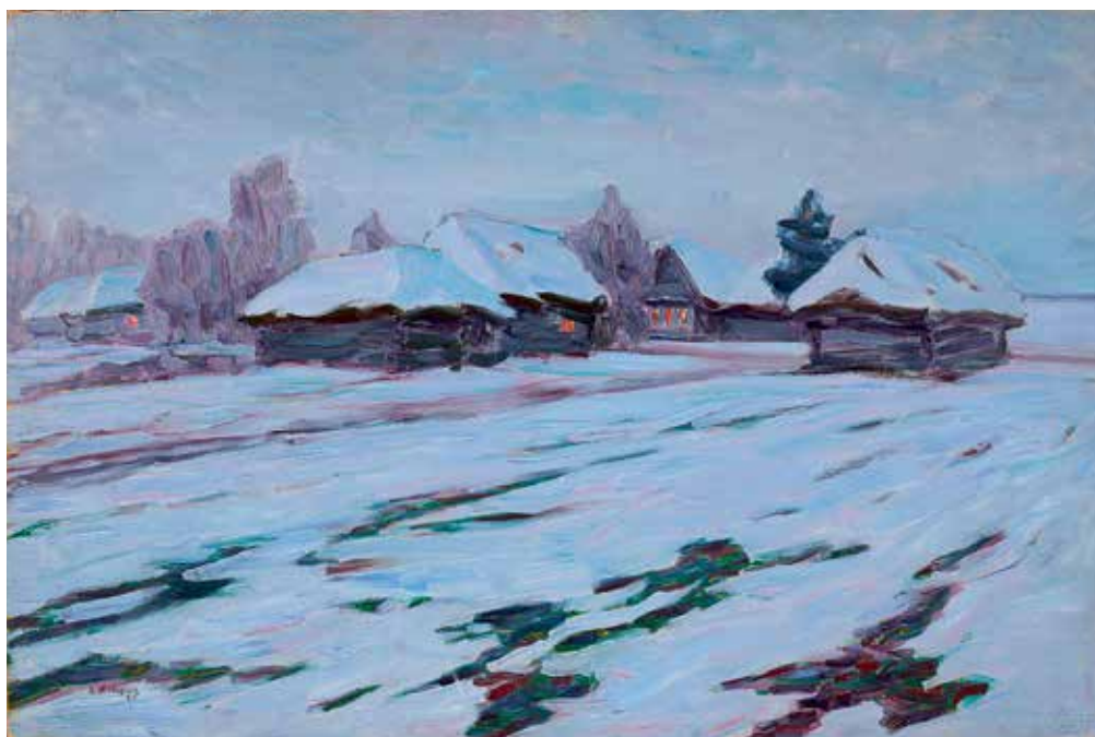
Н.В. Мещерин. Зимний вечер. Деревня. 1905. Бумага на картоне, масло. 66,7x100,6. Государственная Третьяковская галерея. Москва

Что касается художественного уровня выставки «Из виртуального в реальное», он достаточно ровный. Собраны разные по времени произведения, и трудно что-то особенно выделить. Даже если возьмем титульную стену нынешней экспозиции: великолепный Суриков, чудесный Архипов, замечательный Кандинский, прекрасный Рабин и так далее.