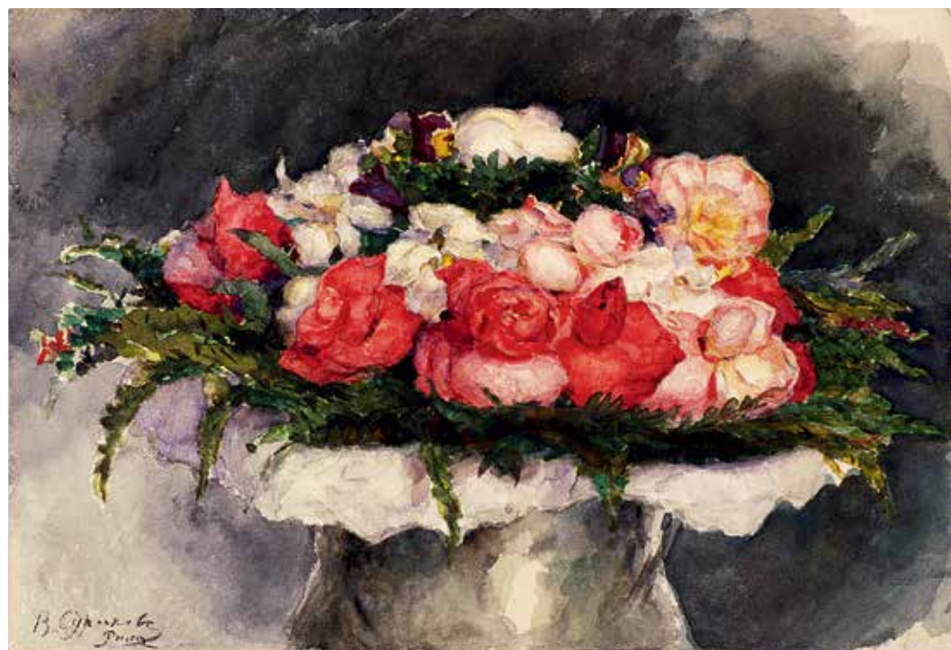
В.И. Суриков. Букет. 1884. Бумага, акварель. 17,4x25,2. Государственная Третьяковская галерея. Москва

Любая выставка готовится долго, не менее двух лет. Для масштабного проекта продумывается концепция, составляются списки произведений по музеям, в том числе региональным. Параллельно идет работа над каталогом. Первоначальные запросы иногда делаются за год: выясняется состояние сохранности, расположены ли они в основной экспозиции, не планируется ли отправка на другие выставки.