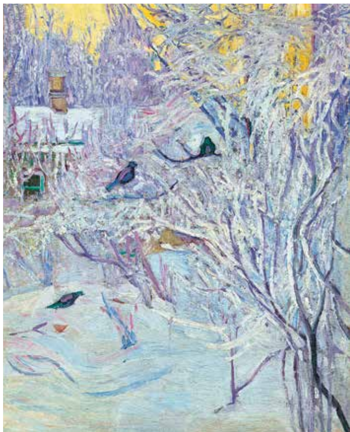
О.В. Розанова. Зима. Снегири на дереве. 1907–1908. Холст на оргалите, масло. 63x51. Государственная Третьяковская галерея. Москва

трудно было найти замену на это место! Стоит одну картину снять – нарушается все остальное! Каждый раз, когда делаю экспозицию, этот момент очень важен – произведениям нужна сцепка. Или работать в противовес!