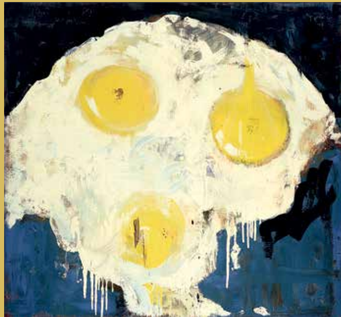
С.В. Шеховцов. Яичница. 2001. Холст, эмаль. 170x182. Государственная Третьяковская галерея. Москва