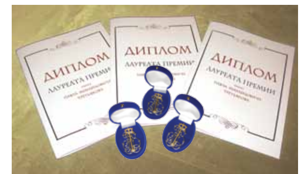
Дипломы и памятные знаки лауреатов премии имени Павла Михайловича Третьякова

лиотеки Москвы, на страницы «Литературной газеты» и «Культуры», в умы и сердца редакционных подписчиков. Через два года я ушла из издательского дома и с редакторской работы, сосредоточившись на экскурсионной в Третьяковской галерее. К концу 2007 года стало ясно, что журнал «не вышел на ноль»... Но к тому времени уже был создан Благотворительный Фонд имени Третьякова, и мы стали сначала соучредителями, а затем (в кризисном 2009 году) полностью взяли на себя и издание журнала. В итоге мы справились, сохранили журнал. «Рус-