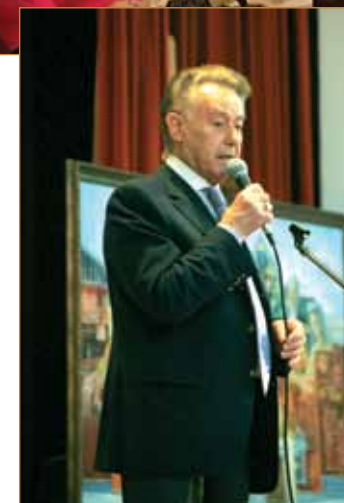
Участники вечеров памяти Павла Михайловича Третьякова